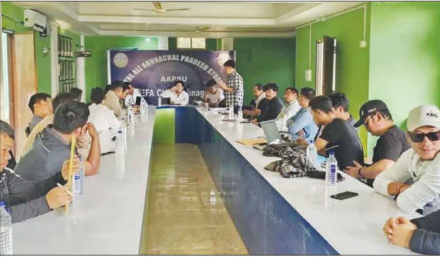
उनाव फोरोंगिरि आरो बिबानगिरिफोरखौ हमनाय जादोंमोन आरो सास्पेन्डबो खालामदोंमोन। नाथाय बावैसो सिगां कर्टनि बिथोनखौ बिथा खालामना बिसोरखौ

इटानगर, 21 जानुवारि : अल अरुनाचल प्रदेश स्टुडेन्ट्स इउनियन (एएफिएसइउ) आ एपिपिएससिनि सौंथि बिलाइ लीग जानाय केसआव थाफानाय सा 6 सोलौंथाइ बिबाननि बिबानगिरिफोरखौ बिबाननिफ्राय बोख्लायनै हेंथा नायबिजिरनो दाबि दैखानानै राइज्यो सरकारनो 7 साननि आल्टिमेटम फोसावदों। बिसोर बिबानगिरिफोरनि गेजेराव ब्लक सोलौंथाइ बिबानगिरिआबो दंफायो। मख 'जाथावदि, सौंथि बिलाइ लीग केसआव लोब्बा थाफानायखौ मिबथिनायनि