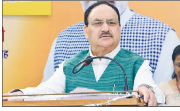
कौटि सुबुंफोरखो सरजावदो। आथिखालाव 62 कौटिनि बांसिन सुबुं एबा हादतनि 45 जौखोन्दोनि बांसिन बैसो गोरा सुबुंफोरा हेल्ट इन्सुरेन्सनि अनगायै बोसोरव 5 लाख रनि स्वास्थ्य आशवासन यजनानि गेजेरजो कभार खालामनाय जादो। आइआइएम आहमेदाबादआव खुंनाय आइआइएम-ए हेल्ट केयार समिटि 2025 आव मन्थिया बे

मिरुनि सावसि मन्थि जेपि नडडाआ आयुष्मान भारतनि गेजेरजो 70 बोसोर आरो बेनि बांसिन बैसोनि 6 कौटि नोगोरारिफोर बेजो सरजावबाय होन्ना बुंदो। बे इन्सुरेन्स प्रग्रामआ आथिखालाव भारतनि 45 जौखोन्दो सुबुं अन्जमाखो कभार खालामो। मिरुनि मन्थि आफादा थानाय अक्टबरआव आयुष्मान भारत प्रधान मन्थि जन आरग्य यजना (एबि पिएम-जेएवाइ)नि गेजेरजो 70 बोसोर आरो बेनि बांसिन बैसोनि गासैबो नोगोरारिफोरनि थाखाय हेट्ट कभारेसखो गनायथि होदो मोन। मन्थि नडडाआ बुंवावोदि, गाहाइ मन्थि नरेन्द्र मदिनि 3 थि सरकाराव गावसोर आयुष्मान भारतनि गेजेरजो 6