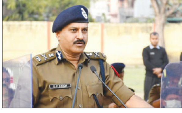
2027 एबा बेनि उनसिमबो बे बिबानआव सिंहआ थानो हागो। 1991 नि आसाम-मेघालय केडरनि आइपिएस बिबानगिरि

आसामनि डिजिपि जिपि सिंहखो सिआरपिएफनि गाहाइ बिथोनगिरि एबा डिरेक्टर जेनेरेल महेरै थिसन्नाय जायो। थानाय 18 जानुवारीखालि फोसावनाय मोनसे बिथोनमानि बादिब्ला, बे थांखिखे कैबिनेटनि थिसनग्रा समिटिआ गनायथि होदोमोन। बिथांनि बिबान आजावनायनिफ्राय 30 नभेम्बर