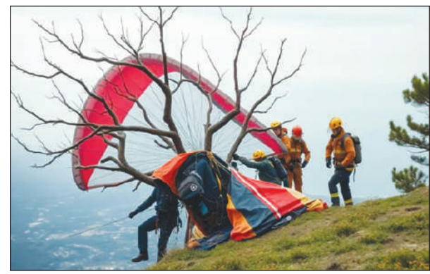
पानाजि, 19 जानुवारी: हाखरआव गोरलैनाय जिउ गोमादो। पुलिसआ मिथिहोयोदि, जाथाया शनिबारखालि मोनाबिलि समाव केरि मुनि गामियाव सोमजिदो।