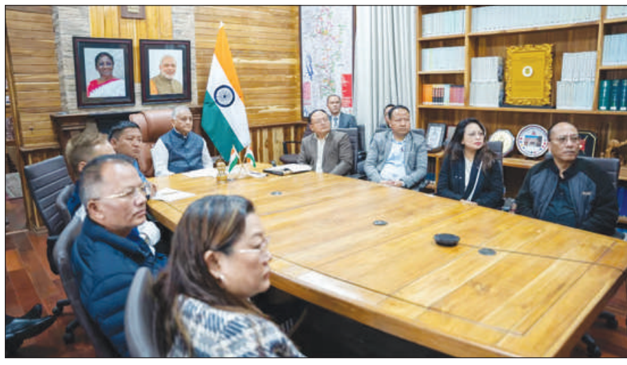
गामिफोरनि थागिबिफोरनो 65 लाखनिखुइबो बांसिन सम्पति कार्ड रान्ना होनाय जादो। बे हाबाफारियाव बाहागो लानाय राइज्योफोरनि गेजेरव मिज 'रामनिफ्राय दर 18

गामियारि हा बिगोमाफोरनि थाखाय मोनसे मख 'जाथाव जौगाखानाय लाबोनायनि नोजोरै मिज 'रामआ स्वामित्व यजनानि गेजेरजो सम्पति कार्ड रान्ना होनाय सा-सान्जा भारतनि गिबिसिन राइज्यो जानो हादो। गाहाइ मन्थि नरेन्द्र मदिआ बे हाबाफारिखो बे खेवनानै होदो मोन। शनिबारखालि मोनसे हादतनां रान्ना होनाय हाबाफारिनि गेजेरजो दर 10 राइज्योफोर आरो दरनै मिरुजो खुंजानाय राइज्योफोरनि दर 50,000 निबो बांसिन