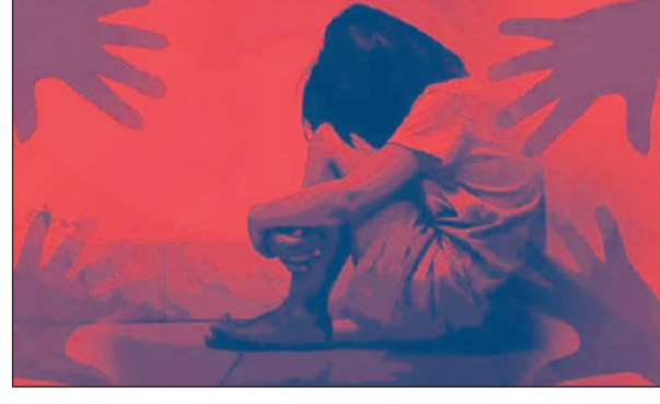
दिल्लीनि बै हटेलनि सिंसिटिथि फु टेसखो गावसोर नायबिजिरनासिनो दं जेराव मेघालयनि हान्जाया थांदोमोन। बे हान्जायाव सा 30 लाइमोन हावाफोर आरो सा 21 हिन्जावफोर, सा 3 बिबानगिरिफोरबो दंमोन। भुगिनांनय लाइमोनखो मेडिकेल टेस्ट खालामनाय जादो आरो पुलिसआ बिनि फिन्नायखोबो थिसनगोन। रिपटनिफ्राय मिबथिनो मोन्दोदि, मेघालय गेलेमु आरो लाइमोन केसफोरनि बिफाननि सासे चुनियर कच आरो सासे बिबानगिरिया 7 जानुवारीखालि राइज्योनि थान्दे हान्जाजो लोगोसे दिल्लीयाव थांदोमोन। बिसोरो 8 जानुवारीखालि राजधानि एक्सप्रेसजो दावबायदो आरो अखानाय दिल्लीयाव सौहैदोमोन। बे हान्जाया गोदान दिल्लीनि करलबागआव थानाय गनै हटेलआव थाथ 'दोमोन।

दिल्लीआव खुंनाय माहारियारि लाइमोन महाउत्सभआव बाहागो लाहैनाय मेघालयनि 19 बोसोर बैसोनि लाइमोन सिखलानि नख 'र माहारियारि राजथावनि दिल्लीनि गंसे हटेलआव जेना गोनां जिनाहारि केसनि लोब्बायै थिसन्नाय मोनसे एफआइआरखो बोखांना लानायनि बाश्ना बुंदो। शनिबारखालि बेनि खोर होनाने मेघालय पुलिसनि सासे बिबानगिरिया भुगिनांनय नख 'र एफआइआरखो बोखांना लानायनि बाश्ना बुंदो होन्ना मिथिहोदो। अदेबानि पुलिसआ गावसोर बे केसखो नायबिजिरनायनि थांखि लादो होन्ना नख 'रनो मिबथिहोयो। मेघालय पुलिस बिबानगिरिया गावसोरनि नायबिजिरनायाव बै जाथाया जायाखैमोन होन्ना मिबथिनो मोनोब्ला एफआइआरखो दिल्लीनि लोब्बा गोनां पुलिस स्टेशनआव दैथाइहरनाय जानाय नड होन्ना रोखा खालामदो आरो बे केसखो गावसोर बेयावनो फोजोबगोन होन्ना थारैनो जाथाया मा जादो मोन बेखो रोखायै मिबथिनो हास्थायनायखो फोरमायदो। पुलिसआ शुकुंनारखालि बुंदो मोनदि,