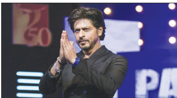
शाहरुख खानआ गावनि गोमोथाव स्टायलनि

थाखाय मुंदांखा। फावखुंगुरनि हिउमारआ जोबोद मोजां। अदेबानि किं खानआ गावनि आंगो बिसि गौरि खानखौ जोबोद मोजां मोनो नाथाय मोनसे बेसाद दं, जायखौ नुनानै शाहरुख खाननि गोसोआ गलिदौं। फावखुंगुरनि लोगो जानायनि बाश्रा सावरायोब्ला बिथांआ फावखुंगुर रिशेश देशमुख आरो बिथानि बिसि जेनेलिया डिमुजाजौं लोगोसे मोनसे गोथौ बन्ड शेरार खालामो। सानैखौ जेब्लायबो सोरनिबा जुलि एबा पार्टीफोराव जयै नुनो मोनो। नाथाय नौथांमोनहा मिबथिगौना मोनसे समाव बे मोजां मोननाया ओरैबायदि बांनो हमदौंदि, शाहरुख खानआ रिशेशखौ जुलिन प्रपजेल होदौंमोन। अदेबानि बेनि जाहोनखौ मिबथियोब्ला नौथांमोनहा थारैसो गोमो हाबगोनो। मेशेबल इन्डियानो होनाय मोनसे इन्टरभिउआव सानसेखालि रिशेश देशमुखआ गावनि बिसि जेनेलियाजौं जयै फेदौंमोन। बे समावनो फावखुंगुरआ बे