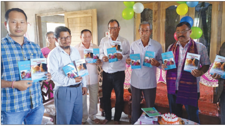
सना माइनाव मुंनि बर' रावनि होदों रनेन चन्द्र मोसाहारिनि खन्थाइ बिजाब बेखेवनानै बिहाव आरौ सना माइनाव