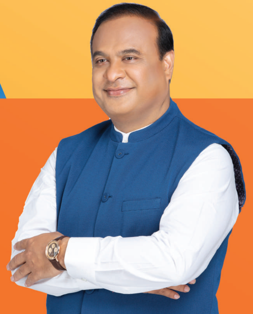
Dr. Himanta Biswa Sarma Chief Minister, Assam