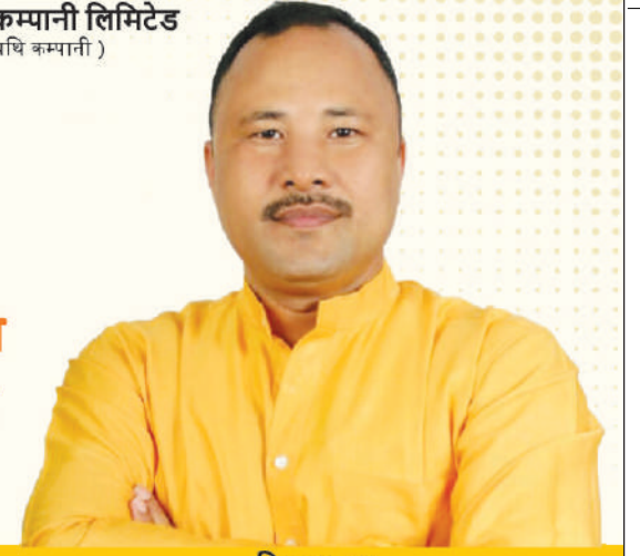
बिमल बरा मोब्लिब गेहेम आरो हाइमोन अन्साय, हरिसु अन्साय, दुरिचम बिकानि मन्त्रि, आसाम सरकार

जौनि बेसेन गोसा ग्राहकफोरनिसिम थि समाव मोब्लिबनि बिलखौ होनो थाखाय खर'गंगलायै खावलायो !