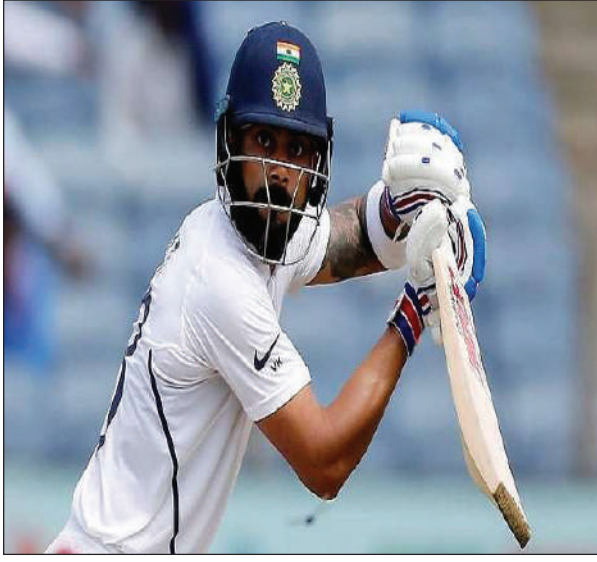
कहलीआ जुदि थामथि टेस्ट मेचव 63 रान लानो हायोब्ला

गोदान दिल्ली, 25 आगस्ट: भारतीय क्रिकेट टीमि केप्टेन भिराट कहलीआ थानाय माखासे समनफ्रायनो गिदर पइन्ट लाखिनो हायाखै। बिथाड 2019 नि उननफ्रायनो गावनि पइन्टनि फारिलाइआव 3 पइन्टखौनो मोनो हायाखैब्लाबो थाब्रैनो सेन्सुरि पइन्ट लाखिगोननि आसा खालामदों। इलेन्डआव बादायनाय 5 खेव मेच टेस्ट सिरिजनि गिबि 2 खेव मेचयाव बिथाड मोजाडै गेलेना दिन्थिफुनो हायाखैमोन। 2 खेबनि मेचनि स्कराव बिथाड 62 रान लानो हादों।