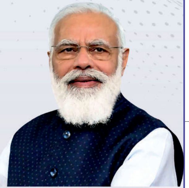
मुखि नरेन्द्र मदि मानगोनां भारतनि गहाय मन्थि

साबायखर मानगोनां भारतनि गहाय मन्थि मुखि नरेन्द्र मदिजी आरु मानगोनां मिरुनि देहा मन्थि