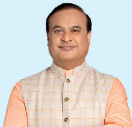
ड० हिमन्त बिश्व शर्मा मानगोनां गिबि मन्थि, आसाम