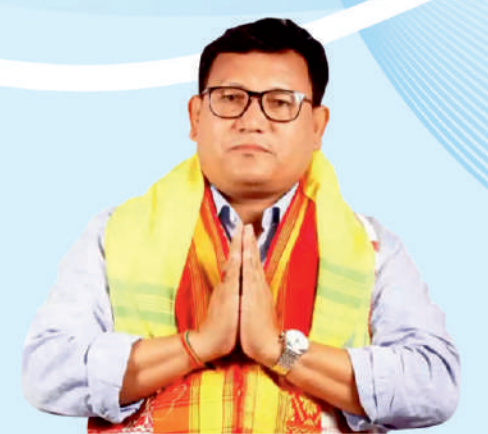
मुस्त्रि प्रमद बर' मानगोनां गाहाय मावफुं सोद्रोमा, बि टि आर