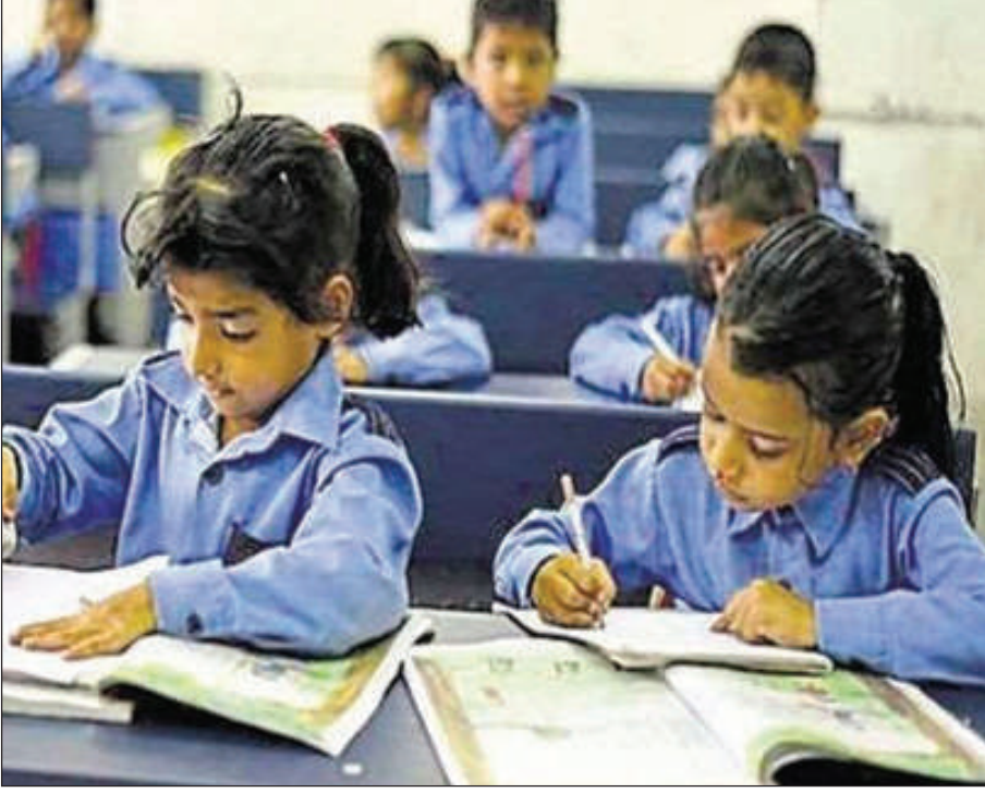
12 थि थाखोनि बर्डनि आन्जादफोरखौबो दोन्थ'नाय जादों। बेबायदियाव बिमा

गोदान दिल्ली, 24 जून: बांसिन बिमा बिफाया आधिखालाव गथ'फोरखौ फरायसालिआव दैथाय हरनो थियारि जायाखै। हादतनि गुबुन गुबुन ओन्सोलफोराव साभं खालामनाय बायदिल्ला 76 जौखोन्दो बिमा बिफाफोरनि बुंदोंदि, जेब्लासिम बिसोरनि जिल्लायव करना इनफेक्सन गोसारनायनि केस फैनाया बन्द जाया एबा गथ'फोरनि भेक्सिन थुनाय जाया अब्लासिम बिसोरो गथ'फोरखौ फरायसालिआव दैथाय हरनो थियारि नडा। मख'नो गोनांदि, हादतआव करानानि नैथि दोहौआ सोलिगासिनो दड आरो 3 थि दोहौ फैगोनखौ फुरा सन्देह खालामदों। बेखौ नोजोर होनानै गसिबो बर्डफोरो 10 थि आरो