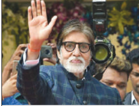
थिसन्नाय जादों आरो इक्विपमेन्टसनि मदतजों गासै 30 बेरामिफोरनि फाहामथायखौ होनाय जाखोबाय। करनानि गिबि दोहौनिफ्रायनो अमिताभ बच्चनआ लान्थियै गोहोम गोमलै जानायफोरखौ मदत खालामदों। थानाय दानआवनो बियो दिल्लीनि गुरु तेगबहादुर कभिड केयार सेन्टारनो 2 कौटि रॉनि हेफाजव हरदोंमोन। बे दान हरनायनि खोरंखो दिल्ली सिख

बयनिबो सिगां इउकेयाव मोन्दोंमोन। इउर'पिय इडनियनआव आधिखालाव बांसिन केसआ भेरिएन्टनि जाहोनाव जादों। एजेन्सिआ बुंदोंदि, आगस्टनि जागायजेन्नायनि सिमाव इइउआव 70 जौखोन्दो केस डेल्टा भेरियेन्टनि जाहोनाव जागोन, जाय दाननि जोबथासिमाव गासै केसफोरव बेनि बाहागोआ बांनानै 90 जौखोन्दो जाहैगोन।