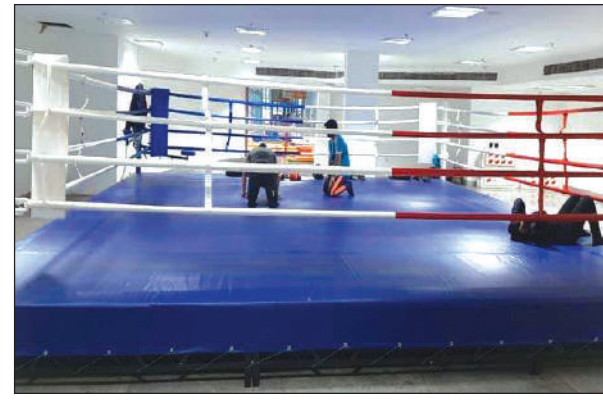
हादतफोरखौ आलादा आलादा जायगाफोराव ट्रेनिंगि लाहोनो

रहतक, 19 जुन : टकिय अलिम्पिकआव मोजाडेगेलेनानै हादतनि थाखाय मेडेल देरहानो हायो, बेनि थाखाय गेलेगिरिफोरा सान हर मोजाडे हुदा खालामदों। स्पोर्ट अथ रिटि अफ इन्डिया (आइ) आ भारतीय बक्सिं टीमखौ ट्रेनिंगि थाखाय इटालीनि असिसिआव दैथाय हरनो थांखि लादों। आथिखालाव आइजो आरु हौवा टीमआ 8 जुलाइसिम इटालीआव ट्रेनिंगि लागोन। इन्टारनेसनल बक्सिं फेडरैसनआ 10-10