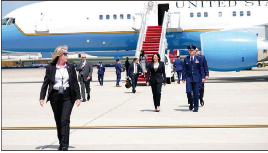
बाइजोयाव ओंखारनायनि उनाव हेरिसआ 'थम्स आप'नि इशारा

जइन्ट बेस एन्ड्रयुस, 7 जुन: आमेरिकानि लेडाइ हादतगिरि कमला हेरिसनि उरां जाहाजनि जेंना जाहोनाव उरायनायनि 30 मिनिट उनाव मेरीलेन्डआव थानाय जइन्ट बेस एन्ड्रयुसआव फैफिनो। मख 'नो गोनादि, हेरिसआ थांनय रबिबाराव ग्लाटेमाता आरो मेक्सिकआव दावबायनो थाखाय ओंखारदोमोन। एयार फर्स टु उरां जाहाजआव बै बेसआव थांफिनो जेरावनिफ्राय बेयो टेक-अफ खालामदोमोन। आधिखालाव उरां जाहाजनिफ्राय रैखाथिये