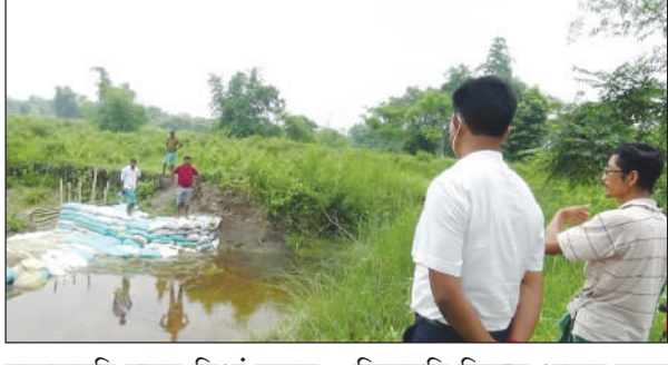
रुजुन्नायनि उनाव बिथां जयन्त बसुमतारिआ दासान्दि गावनि बियाबनि सिडव थानाय गुबुन गुबुन गोल्लैसोनाय गामिफोरख

चिरां, 3 जून: आसाम बिधान सभा बिसायख'थियाव 31 न सिडलि बियाबनिफ्राय देरहासाद जालांनो हानाय एम एल ए जयन्त बसुमतारिआ राइजो-राजाफोरजों दिसपुराव दैथायहरजानाय हिसाबे गावनि गिलर बिबान रुजुन्नायखौ मावफुंनायनि नोजेरजों गावनि बियाबनि सिडव थानाय जेनाफोरखौ बोस्त्रानायनि फारसे आखाय हमजेनो थांखि लादों। एम एल ए महैर बिबान