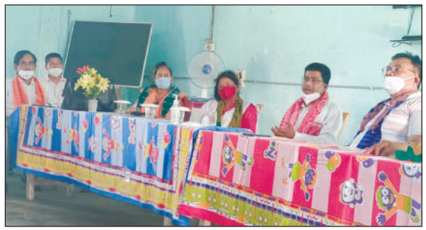
उदालगुरि, 3 जून: उदालगुरि जिल्लानि टंला पुलिस थानानि सिडव थानाय र'ज एन डि अ आव दिने बि टि चिनि समाज

सामब्लायगिरि ललित बर', आफादगिरि जेजेस बर'जों एन जि अ नि गुबुन गुबुन बिथिनि सायाव सावरायलायो। एन जि अ नि सिडव सामब्लाय जाबोनाय जिल्ला चाइल्ड लाइन आरो गथ'सा थाग्रान'नि आंखाव-अजदफोरनि सायाव सावरायलायो। गुबुन फासेंथि चाइल्ड लाइननि मावफारि अरुप बर' आरो गथ'सा थाग्रान'नि सुपारिटेन्डेन्ट हिरामनि ( 5 बिलाइआव )