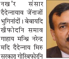
नख'र संसार दैदेन्नायाव जेनादों भुगिनादों। बेबायदि खैफोदनि समाव गाहाय मन्थि नरेन्द्र मदि दैदेन्नाय मिह सरकार गोरिबफोरनि थाखाय गोजो-थाव बाथा फोसावदों। जायफोरा गोरिब थाखोनि सुबुंफोर आरो रेसन कार्ड गैजाया अब्ला बे खेबाव रेसन कार्ड मोन्नो हासिगोन।

गोदान दिल्ली, 3 जून: सोलिफु गिखंथाव कभिड महामारिनि जाहोनाव हादतनां लकडाउन फोसावनाय हिसाबे दासान्दि हादतनि गोबां सुबुंफोरानो थाना थानायनि बेलायाव खैफोदजों मोगा-मोगि जानांगसिनो थार्दों। जरखायै गोरिब थाखोनि खामानि मावनाने जाग्र आरौ फिसा-फिसौ फालांगियारि खालामनाने जाग्र सुबुंफोर गावबा-गावनि