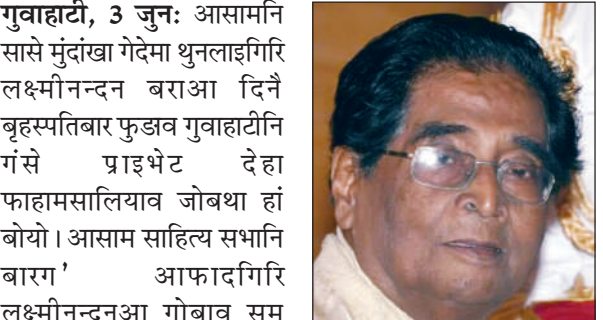
मख'नाय जायोदि, आसामनि नगाव जिल्लानि हातिसुं गामिआव थानाय 1932

कक्राझार, 3 जून: मुंदाखा थुनलाइगिरि, साहित्य एकाडेमि बान्था मोनगिरि, सल'मागिरि पद्मश्री लक्ष्मीनन्दन बरानि रंसारि जानायखौ बर' थुनलाइ आफादआ गोथी दुखु फोरमायदों। गोबाव सम नाडै लोमजानायजों नाखोबजानायनि उनाव बिथां बराआ दिने 89 बोसोर बैसोयाव रंसारि जाबाय। बिथांनि रंसारि जानायाव आसामनि हारिमा जिडयाव सासे रफोद थुनलाइगिरि सानसुमैखौ खोमानांबाय। रंसारि बरानि दुखुथिया नख'निमिस दुखु फोरमाय हनयजों लोगोसे रंसारि लक्ष्मीनन्दन जिडयाव सोगोंयाव आलो-गोजौने थाहैथों बेनि थाखाय बर' थुनलाइ आफादआ इसोरनि खाथियाव आर'ज गाबो।