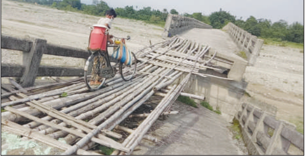
मोगि खालामबोदों। 62 न बरमा बिधान सभा बियाव एबा बि टि चिनि 23 न दिहिरा

बाक्सा, 3 जून: बाक्सा जिल्लानि भारत-भुटान सिमानि नांजाबनाय ओन्सोल सुबनखातानि गोथी पागलदिया दैसानि सायाव लुफुं जानाय सुबनकाता-निकासि आरो जिल्लानि सदर मुसलपुरनि सुबुंफोरनि गेजेराव फोनांजाबहोनाय गंसेल' दालाड दिने बायग्रेब लांदों। बायग्रेबलानाय बे दालाडा ओन्सोलनि सरासनस्रा सुबुंफोरखौ गोबां जेनाजों मोगा-