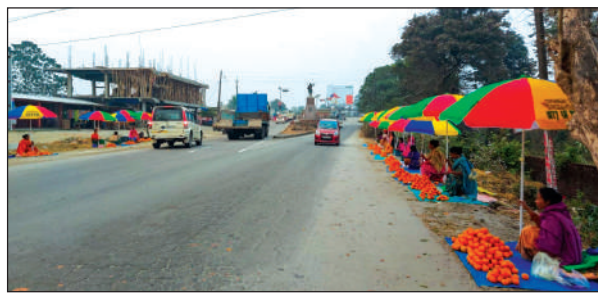
दुलाराय भारतीय आर्युबिज्ञान फसंथान, गुवाहाटीनि सोलेंथायारि हाबाफारि बेखेवनाय मेलआव गिबि मन्थिआ बाहागो लादों मिरु आरो राइज्यो सरकारआ एडम्स, गुवाहाटीनि आद्रा थानाय खामानिफोरखौ थाबैने मावफुंगोन: गिबि मन्थि

कक्राझार, 12 जानुवारी: बिटिसिनि गाहाय थावनि कक्राझारखो सिटी अफ पीस एबा गोजोननि नोगोर महरै दाफुंनो सिगाडव फोसावखानाय बादिदै सोलिफु बिटिसिनि गाहाय खुंगिरि प्रमद बर'आ बे हाबाफारिखो (□ 5 बिलाइआव)