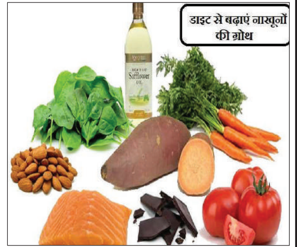
डाइट से बढ़ाएं बास्कुनों की ग्रोथ

गोलाव आरो समयना आसुगुरखौ साफ्रोम हिन्जावफोरानो मोजां मोनो। गोलाव आरो नेलपलिस फुन्नाय आसुगुरआ नायनो मोजां जानायजों लोगोसे नोंथांनि आखायफोरनि समयनाखौबो बांहोयो। माखासे सुबुंफोरनि आसुगुरआ जेसे लुबैयो एसेनो लावयो, नाथाय माखासे सुबुंफोरनि हिन्जावफोरनि आसुगुरआ क्चिचनआव खामानि मावनायावनो बायो। आसुगुर बायनायनि बयनिखुइ देरसिन जाहोना देहायाव जाना-लौनायनि बाडाइ जानाय। आसुगुरफोरखौ समयना आरो हेल्दीया लाखिनो थाखाय पालारनि अनगायै देहानो लावहोनो हानाय गुन आरो प्रटिनजों बुंफबनाय जाग्रा आदारनि गोनांथि जायो। जुदि नोंथांनि आसुगुरआ बायोब्ला नोंथांनि बयनिबो सिगाडव गावनि डाइटआव साबम्रानाय लाबोगो।