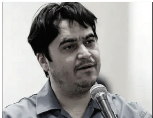
सुबुंफोरनो खौरां होयोमोनदि, जगोन। लोगोसेनो बिनि धर्ना होनाया बेसेबां रिगायाव सायाव शिया धर्मतन्त्रखौ