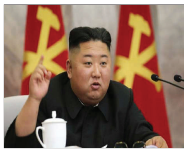
बुंदोंदि रेखाथि परिषदयाव उदाइँ सावरायलायनो थाखाय जार्मनिआ मोन 9 था भटखौ मोननो हायाखे। जार्मनि आमेरिका, ब्रिटेन आरो फ्रान्सजों लोगोसे दर 7 हादतफोरा बुंदों सा-करिया सान्थि आरो गुन्नासा गोहोखौ

इउ एन, 12 डिसेम्बर: दर 7 सोनाबयारि हादतफोरा इउ एनआव सा-करियानि सायाव थोंजों दाय जाबसिन्दोंदि, बियो करना इनफेक्सननि जाहोनाव सुबुंफोरखौ इनाय अनागार खालामदों। सा-करियानि खु गिरिया नोगोरारिफोरनि सायाव बायदि बायदि रोखोमै होबथादों। इउ एननि रेखाथि परिषदयाव सा-करियाआव सुबुं मोन्थायखौ दबथायनायनि केसयाव सावराय लानायनि उनाव बार्चुएली मोनसे बिबुंथि होनायखौ फोसावदों। जार्मनिनि रेखाथि परिषदयाव बे केसनि सायाव उदाइँ सावराय लायनो थांखि लादों। नाथाय सा-करियानि नसु हादत चीन आरो रूसआ बेखौ हँथा होदों आरो