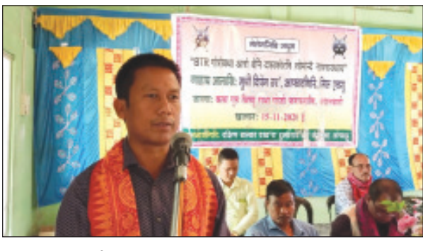
बरमा, 15 नभेम्बर: बागसा जिल्लानि दक्षिण बास्का एबसुनि बान्जानायाव दख’रा आफादनि सिङव थानाय मेलेम-जिवि आरो

गुबुन गुबुन हारि-माहारिनि गागि दैदेनगिरिफोरखौ लानानै अदालबारिनि कलारु भिष्णु राभा गोजो फरायसालियाव बि टि आर गोरबथानि सायाव “मेलेमजिवि” जथुम खुंनया जायो। दख’रा एबसु आफादनि आफादगिरि महत बर’नि दैदेन्याय खुंनया बे मेलेमजिवि जथुमखौ बेखेवनानै होयो दुलाराय बर’ फरायसा आफादनि बोसोनिगिरि मानगोनो मुधि खुंनया स्वर्गीयारी। मेलाव गाहाय आलासि महरै बाहागो लायो दुलाराय बर’ फरायसा आफादनि (□ 5 बिलाइआव)