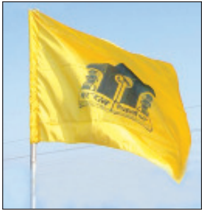
थाखेयाव मोनफैबाय। दिनैनि बे गोथार सानाव साक्रोमबो बर’ फिसाफोरखो गावनि बिमानि रवे रइन्नायनो, लिस्नो हांखायहरदों

गुवाहाटी, 15 नभेम्बर: बर’ थुनलाइ आफादनि गोथार जोनोम सान 16 नभेम्बर। बे सानखालिनो 1952 माइथायाव बर’ थुनलाइ आफादआ जोनोम मोन्दों मोन। बर’ थुनलाइ आफादनि बैसोआ दिनै 16 नभेम्बरवा 69 बोसोराव हाब्याय। जोनोम जाजेन्नायनिफ्रायनो गोबंथांर जेना-जेगोनोजो मोगा-मोगि जानानै फैनांनया बर’ थुनलाइ आफादआ दिनैसिम बे