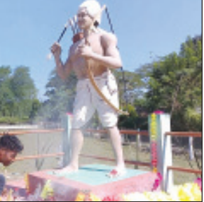
मिरु एबसुआ बिर्सा मुन्दानि जोनोम सानाव गाहाम हामब्लायथि हरदों

उदालगुरि, 15 नभेम्बर: उदालगुरि जिल्लानि माजबात खुन्नाबारि गामियाव गुबुन बोसोरफोरनि बादि दिनैबो बिर्सा मुन्दानि 145 थि जोनोम सान फालिनाय जायो। खुन्नाबारि बिर्सा मुन्डा आफाद आरो लाइब्रेरीनि बान्जानायाव सानसेनि हाबाफारिजों (□ 5 बिलाइआव)