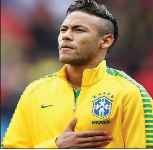
थमास टकेलआ थांनाय सप्ताहआवनो गेलेनो हानाय

ब्राजिल फुटबल आफादआ रोखा खालामदों-नेडमारआ मोन्टेभिडियोआव खुंजानो गोनां खोला आमेरिका क्वालिफाई मेचखौ गेलेनाय नडा। पेरिस सेन्ट जार्मेनि कच