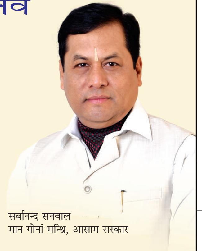
सर्बानन्द सनवाल मान गोनां मन्थ्र, आसाम सरकार

आसाम सरकारआ राव-थुनलाइनि जौगाखानाय बेलयाव जर 'खा बिहोमा होनाय राइज्योनि मोनफ्रोमबो थागिबि रावनि सायख 'जानाय लिरगिरिफोरखौ बरायनो थाखाय बे बिथांखिखौ आजावनाय जादों। थि खालामनाय फारिखान्थिनि बिथायाव सायख 'जानो गोनां लिरगिरिफोरनो नोगोद 50 रोजा रां आरो गांसे बराय लाइजो बरायनाय जागोन।