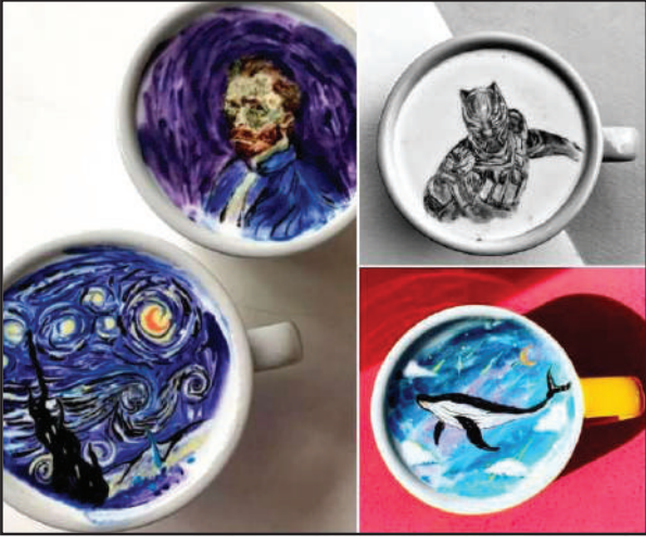
लाइफस्टाइल डेस्क, 30 अक्ट 'बर : कफीआ खालिबोल' जाथोसे डिंक नडा, बेयो नोंथांखी फुडव फोजानायनिबो हाबा