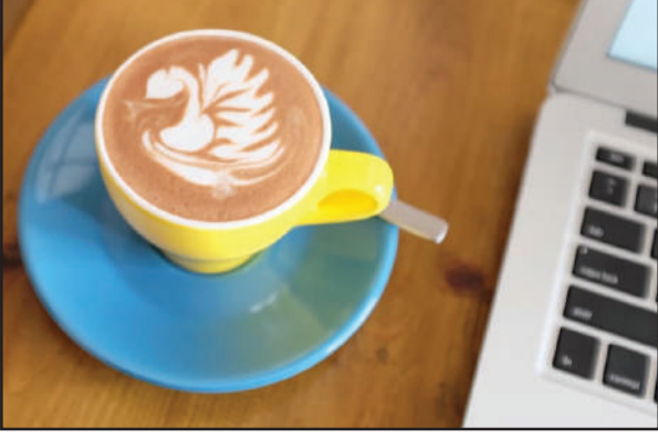
मावयो। नाथाय बेयो मोनसे रोखोमनि सानायबो होयो। जायफोर सुबुडा कफी लोंगो लुबैयो, बिसोर बादि सुबुफोरनो फुंबिलिनि