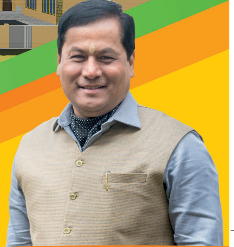
सर्बानन्द सन 'वाल गिबि मन्थ्रि, आसाम