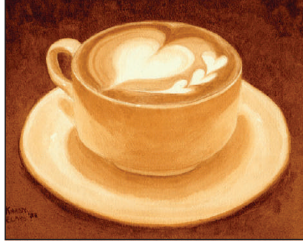
बाइदिसिना रोखोमनि सावगारिजों कफी आर्ट खालामानानै लोंग्राफोरनि गोसो गोजोन होनाय जायो।