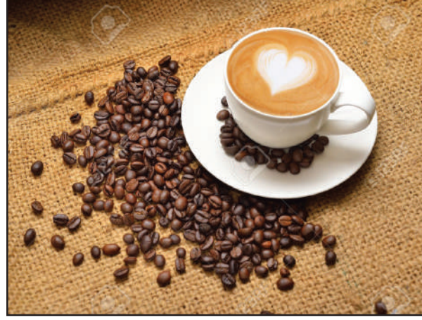
खोला करियाआ कफी आर्टया बयजोंबो बाखाय जानाय मोनसे रोखोमनि डिंकस। कफी गलाफोरव हाबहैयोब्ला कापआव

सुदेम समाव कापसे कफीनि गोनांथि जाथारो। बेयो कैफीसिनि, एक्सप्रेसो एबा जायखि रोखोमनि कफी जायामानो।