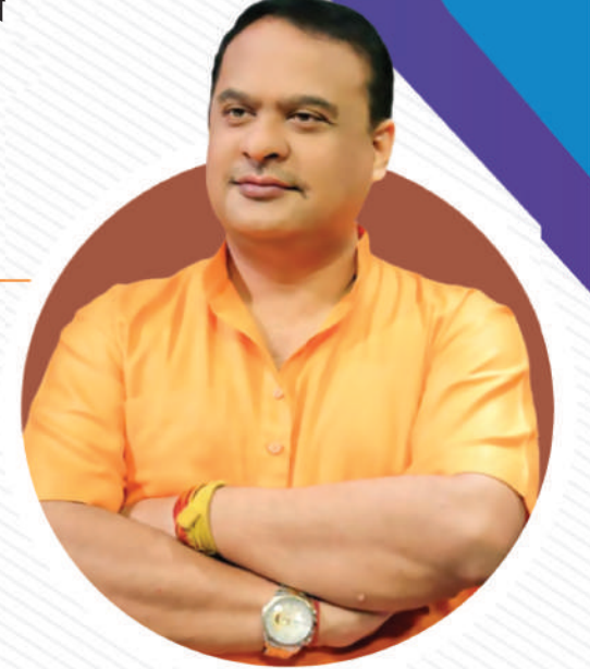
ड॰ हिमन्त बिश्व शर्मा मानगोनं मन्थि, रंखान्थि, देहा आरो नख'र अन्साय, पिडब्लिउडि बायदि

जिएडि भवन, पानबाजार, गुवाहाटी-781001 दुरभाष-0361-2730515 (गाहाय कमिसनार) आरो 96781-80794 (रेजिस्ट्रार) वेबसाइट: https://pranam.assam.gov.in