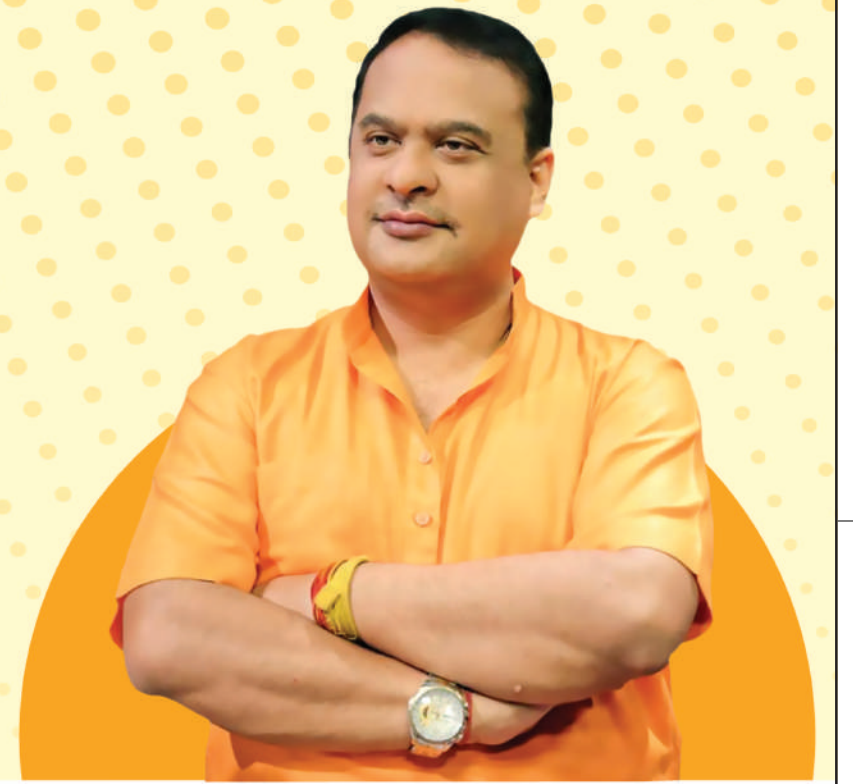
ड॰ हिमन्त बिश्व शर्मा मानगोनं रंखान्थि मन्थि, आसाम सरकार

अरुनदय बिथांखि मावफुंनयनि गाहाय थांखिया जादों राइज्योनि गोखि उदां खालामनाय आरो रंखान्थि बिथिडव गोग्लैसोनाय नख'रफोरनो रंखान्थि आरो समाजयारि मान थाखोखौ फोजौखांहोनाय।