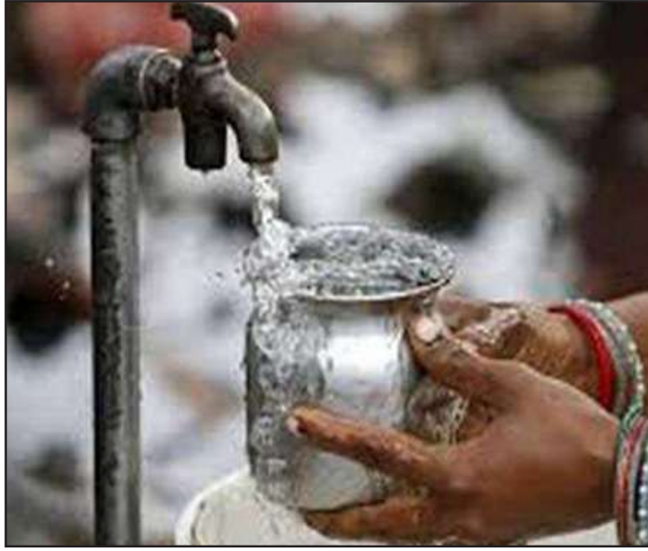
हाबाफारिखौ जाफुंहोनु थाखाय 100 साननि अभियानखौ जागायबाय। मख'नो गोनादि, जल जीवन मिसननि थांखिया फेगौ 2024 सिमाव

गोदान दिल्ली, 3 अक्ट'बर : हादत नाडैनि फरायसालि आरो आंगनबाडी मिरुफोराव गोगो लोंग्रा दै जगायनानै होनो थाखाय मिरुयारि दै गोहो बिफानआ थांनय शुकुबारखालि 100 साननि अभियानखौ जागायो। बेनि गेजेरजों मिरुआरि दै गोहो मन्थि गजेन्द्र सिं शेखाबाटआ गासै राइज्योफोर आरो मिरुजों खुंजानाय राइज्योफोरखौ बे हाबाफारिखौ जगायनो खावलायो। बेजों लोगोसे बिथाड गासै गिबि मन्थि आरो लेडइ राइज्यो बेंगिरिफोरनो लाइजाम लिरहरनानै बिसोरखौ ओन्सोलफोराव हाबाफारिखौ दैदोन्नोखावलायदों। बे हाबाफारिखौ जागायनानै शेखाबाटआ महात्मा गांधीनो बिन 151 थि जोनोम सानाव बिबार बावयो। बे समाव बिथाड बुंनय बायदिल्ला गाहाय मन्थि नरेन्द्र मदिआ थांनय 29 सेप्टेम्बर जल जीवन मिसनखौ लन्स खालामनानै सुबुंफोरखौ हादतनि गासै फरायसालीफोर आरो आंगनबाडी मिरुफोराव लोंग्रा गोगो दै जगायनानै होनो खावलायदोंमोन। बे