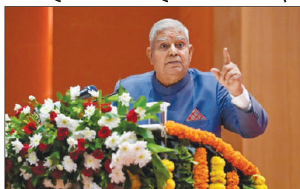
थिसन्नायाव भारतनि गाहाइ बिजिरिगिरिया माबोरै थाफानो

गोदान दिल्ली, 15 फेब्रुवारी : गोहोफोरखौ बोखावनायनि सायाव लेडाइ हादतगिरि जगदिप धनखडुआ गिदिर फिन्नाय होदों। बिथाड बुडोदि, जौनि बायदि हादतआव एबा जायखि जाया सुबुं खान्थियाव आइनारि बिथोननि बायदिगै गाहाइ बिजिरिगिरिया सिबिआइनि बिथोनगिरि थिसन्नायाव माबोरै थाफानो हागौ? बेनि थाखाय माबाफोर आइनारि बानबुथि थानो हागौ नामा? होनाबो बिथाड सोंथि खालामो। जगदिप धनखडुआ बुडोदि, स्टेयुरी इन्स्पेक्शन आ बेनिखायनो दाजादों, मानोना बै समनि इक्कीकित्तिभआ बिजिरिगिरिया बिथोननि सेराव गंगलायदोंमोन। नाथाय बेनि सायाव सावययफिन्नायनि समा फैबाय। बेयो सुबुं खान्थिजों गोरोबा होनायै बिथाड सोंथिबो खालामोदि, जायखिजाया हाबाफारि मावफारिया एबा बिबानगिरि