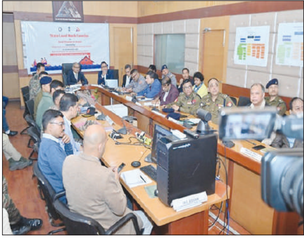
साबखानाया लाबोनाय आरो गासै फुवाराया। बे हाबाफारियाव गासै मोन 10 जिल्लाफोर- कामरूप,

गुवाहाटी, 20 डिसेम्बर: एनडिएएमएआ आसाम राइज्योआरि अलखद सामलायग्रा अटरिडि (एएसडिएएमए) नि हेफाजाबजौ दै बानानि लखदनिफ्राय बारग'नायनि थियारिफोर आरो हाबाफारिनि सायाव मोनसे गुवार राइज्योआरि थाखोनि मक हुदा खालामो। बे हुदाखौ मोननै खोलोबाव खुनाय जादौमोन। थांनय मंगलबारखालि मोनसे टेबोलटप हुदा आरो देहायारि मक हुदा खुडे। बे हुदानि थांखिया दै बानानि थियारिफोरखौ गोखौ खालामनाय, इन्टरिम एजेन्सियाव