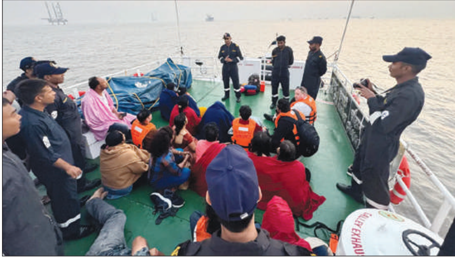
सशरल मिडिया प्लेटफर्म एक्सआव बेनि खौरं होयो। गाहाइ नाव जाब्रबथायाव जिउ

महाराष्ट्र, 19 डिसेम्बर : नेभिनि जाहाज इन्जिनआ बेलासिनि 4 रिंगायाव निलकमल मुनि गंसे नावजों सौग्रावदोंमोन। बे इन्जिना टेस्टनि थाखाय थांगसिनो दडमोन। नावआव सा 100 निखुइ बांसिन सुबुंफोर गाखोदोंमोन। बे जाब्रबथायाव सा 13 सुबुंफोरनि जिउ गोमायो। महाराष्ट्रनि मुम्बाइआव जानाय नाव जाब्रबथायाव सा 13 सुबुंफोरनि जिउ गोमानायनि उनाव पिएम मदिआ 2 लाखनि अन्सुंथाइ फोसावयो। गाहाइ मन्थि मावख 'नि फारसेनिफ्राय