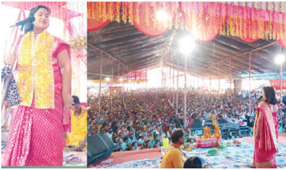
मालिगाव आदिबासी झुमुर हारिनि हान्जाया नाम किंत्तन

बिजनी, 6 जानुवारि: चिरांनि बिजनी 1नं बिष्णुपुरआव 3थि बोसोरारि महानम सकिंत्तन 16 प्रहर नाम यज्ञ, अष्टकमल लीला किंत्तन आरो फोरबो फालिनाय जादों। थानाय 2 जानुवारिनिफ्राय जागायनाय फोरबोनि दिनै अष्टकल लीला किंत्तन फोरबोखौ खुंफुंनाय जायो। बिटिआरनि मावफुंगिरि सोद्रोमा धनज्य बसुमतारिआ बाहागो लानाने मावख 'नि दरखंखौ बेखेवो। नाम किंत्तनखौ 3 आरो 4 जानुवारिआव सान-हर दिन्थिफुंनाय जादोंमोन। नाम किंत्तन हान्जाफोरनि गेजेराव सोनाब बेंगलनि दिनाजपुरनि