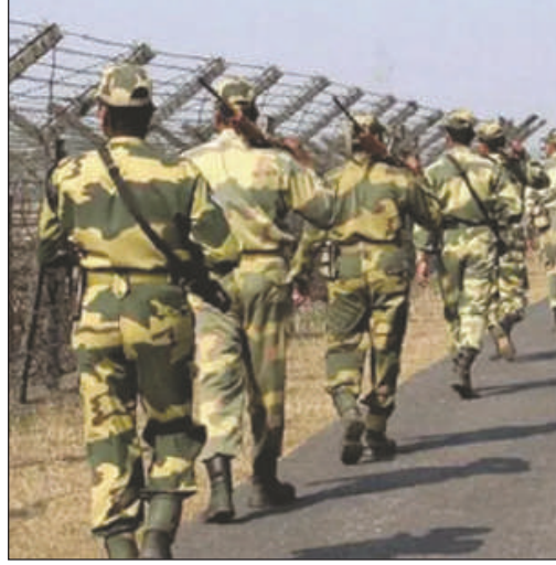
सिमनायाव थानाय रानिनगर थानानि सिडव रजानगर सिमना साखाथियाव बिएसएफ

कलकाता, 8 डिसेम्बर : न'सुसे हादत बांलादेशआव सोलिबाय थानाय हिंसायारि जाथायफोरखौ नोजोर होना सिमना बारनानै हाबफैखोमानाय आरो आइन बेरेखा हाबाफारिफोरखौ होबथानायजों लोगोसे भारतयारि आबादरिफोरनि रेखाथिखौ रोखा खालामनो थाखाय बिएसएफआ मुसिदाबाद जिल्लायाव भारत-बांलादेश इन्टरनेशनल बर्डरआव 0 लाइननि साखाथियाव गावनि जवानफोरखौ थिसनदों। मावख'यारि महरै थिसनयानि उनाव सोनाब बंग'नि बांलादेश