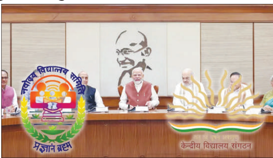
फरायसालिफोरखौ फेगौ 8 कौटि रं खरसा खालामगोन। बोसोरनि गेजेराव लुफुंनय बे गासिबो पिएम-श्री स्कुलफोरनि महराव हाबाफारि

गोदान दिल्ली, 7 डिसेम्बर: गुन गोनां सोलौंथायखौ हादतनि जोबथा मारुसिम थानाय सुबुंफोरनि गेजेराव गोसारहोनो नांथाबनाय मिरु सरकारआ हादतआव गं 85 सेन्ट्रल स्कुल आरो गोदान गं 28 नभदया स्कुलफोरखौ खुलिनो थाखाय फोसावबाय। बयनिखुइ बांसिनै गं 13 सेन्ट्रल स्कुलफोरखौ जम्मु-काश्मीरआव खुलिनाय जागोन। फारसेथि, गं 28 गोदान नभदया स्कुल खुलिनो फोसावनायनि गेजेराव बयनिखुइ बांसिनै गं 8 खौ अरुणाचल प्रदेशआव खुलिगोन। बेफोर