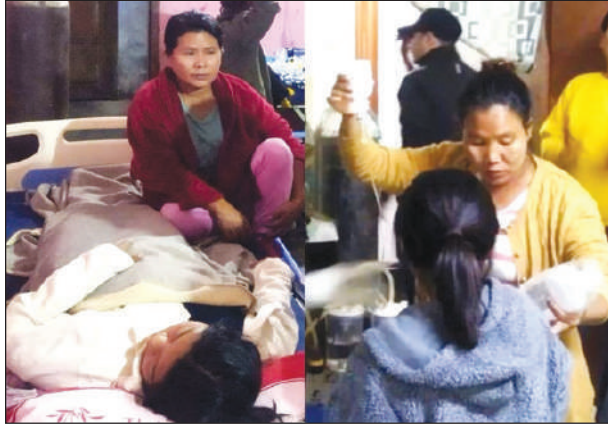
लाइमोनफोरनि जिउखों थि समाव रेखा खालामनो हायो आरो आथिखालाव बिसोरनि थासाखिआ गहाम जाबाय।

इम्फल, 19 नभेम्बर: मनिपुरनि तेंनौपाल जिल्लानि मरेहआव थानाय गंसे फरायसालिआव फुड पडजनि जानायनि उनाव आसाम राइफल्सआ सा 130 गथ 'फोरनि जिउखों रेखा खालामो। बिसोर सा 130 फरायसाफोरनि गेजेराव सा 22 हौवासा आरो सा 108 आ हिन्जावसाफोरमोन। आसाम राइफल्सआ समबारखालि मोनसे प्रेस बिबुथियाव बुडोदि, मरेह गुदि देहा मिरु (पिएडसिस) नि गेजेरजों सांग्रां खालामनायनि उनाव मिरु पेसामिलितारिनि मोनसे मेडिकेल टीमआ थाबैनो गोनांथि जानाय मुलिफोर आरो पाहामथायनि थाखाय गोनां मुवाफोरखों जाथाय जानाय जायगायाव सौहेहोयो। आसाम राइफल्सनि फाहामथायारि बिबानगिरिनि गेजेरजों बिथोन होनाय आरो तेंनौपालनि गाहाइ फाहामथाय बिबानगिरिनि दैदेन्यायव टीमआ गोहोम गोगलैनाय गथ 'फोरखों फाहामनो थाखाय पिएडसिस मावसुमाफोरजों लोकोसे जुथायै हावा मावो। आसाम राइफल्सनि मरेह बेटेलियनि मावसुमाफोरा फुड पडजनि जानाय फरायसाफोरखों जोथोन लायो। सुलुनि बादिब्ला, आसाम राइफल्स आरो फाहामथायारि बिबानगिरिफोरनि बे जुथाय नाजानायनि फिहाइ महेरै सा 130