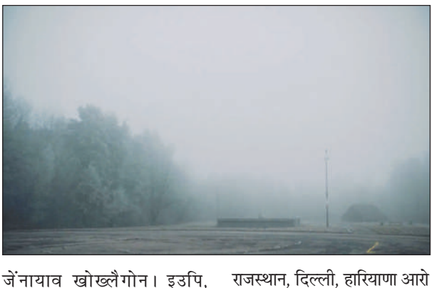
जेनायाव खोख्रैगोन। इउपि, रजस्थान, दिल्ली, हरियाणा आरौ

गोदान दिल्ली, 14 नभेम्बर: सा-भारतआव बुधबारनिफ्राय हरखाबै बोथोर सोलायो आरौ खुवा खुनायजों लोगोसे गुसु मोन्दानो हमारौ। सा जम्मु-काश्मीरनि हाजोफोरार सोनाबारि नारसिन्थायनि गोहोम गोरलैनायखौ थांनाय मंगलबार हर गेजेरनिफ्राय नुनो मोनो। हाजोफोरार बरफ गोरलैनायनि गोहोमखौ हायेन ओसोलफोरारबो नुनो मोन्दों। फेगौ माखासे साननि उनाव साननि समावबो गुसुआ सुबुफोरखौ