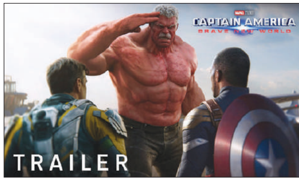
जोबोद मोजां मोनगासिनो दड। ट्रेलारआ रिलिज जानाय लोगोनो अन्सायगिरिफोरनि फिदवेक

'केप्टेन आमेरिका: ब्रेभ निउ वाल्ड' नि गोदान ट्रेलारआ माखासे सम सिगांनो रिलिज जाबाय। सावथुननि ट्रेलारआ सुपारबिलेननि मुजिथावना दावबायनायखौ खोथा होयो। सावथुनाव हेरिसन फर्डआ थेजियस रसनि महराव गावनि एमसिइउखौ डेब्यु खालामदों। आरो सेम उड्ल्सननि केप्टेन आमेरिकानि बेरेखायै रेड हाल्कखौ दिन्थिदों। सावथुननि मुजिथावना ट्रेलारखौ नुनानै अन्सायगिरिफोरा एक्साइटेड जादों। सोसिफु बोसोरनि मुंदांखा हलिउड एभेन्जार्स सावथुन 'केप्टेन आमेरिका: ब्रेभ निउ वाल्ड' खौ लानानै उन्सायगिरिफोरा जोबोद एक्साइटेड जानानै दड। बे एक्साइटेडखौ नायनानै मार्वल स्टुडियोफोर बे सावथुननि गोदान मुजिथावना ट्रेलारखौ दिने माखासे समनि सिगांनो फोसावबाय आरो नायगिरिफोरा