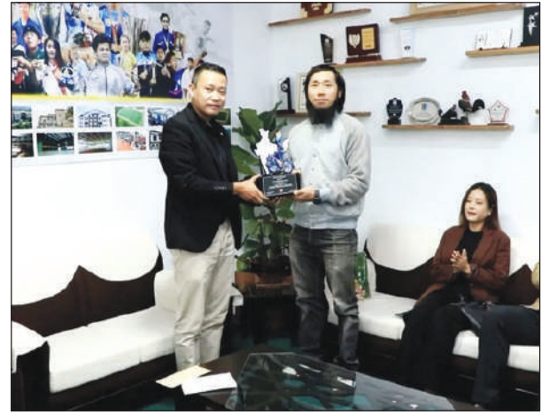
आइजलिनि मिशन वंगआव सालायनायनि हाबाफारिखौ गावनि साइकेल फोजोबदों।

गोदान दिल्ली, 9 नभेम्बर: मिज 'रामनि गेलेमु मन्थि लालनिशिंगलवा हमारआ शुक बारखालि साइकेल सालायगिरि वानलाललाव मजुआला वतें एबा लजा वतेंखौ मान बाउदों। मन्थिया वतेंनो बिथानि मोन्नो गोनां सनमानआव अन्थोब आरो रांखान्थिनि अन्सुंथाइजों मान बाउदों। गोग्गो आरो गाहाम देहानि सोमोन्दै सांग्रांथिखौ गोसारहोनायनि मिशनजों लोगोसे, मिज 'रामनि साइकेल सालायगिरिया बे सोलिफु बोसोरनि 24 जानुवारीखालि गावनि साइकेल सालायनाय हाबाफारिखौ जागायदोंमोन। बिथांआ 281 सानआव मोन 28 राइज्योफोर आरो मोनबा मिरुनि इडनियन टेरिटरिसफोराव 17,000 किल 'मिटारनिखुइबो बांसिन गोजानखौ थांखि लादों। वतें आ 5 नभेम्बरखालि