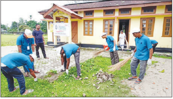
बिथोनयाव जिल्ला नाडै माइ भारत गाव गोसोयारि सिबिथाय

गसाइगाव, 29 अक्टूबर: नेहरु युव केन्द्र कक्राझारनि बान्जायनायाव माइ भारतनि बोसोरसे आबुं जाफुंसारनायखौ लानानै हाबाफारि खुंनो दिपाबली उइत माइ भारत हाबाफारि खुंनय जादों। बे हाबाफारिनि सिडाव नेहरु युव केन्द्रनि जिल्ला लाइमोन बिबानगिरिनि