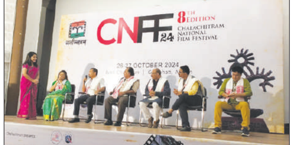
चेलाचित्रम नेशनेल ड्राइनिथि हाबाफारिखौ फिल्म फेस्टिभेल-2024 नि शनिबारखालि गुवाहाटीनि ज्यति