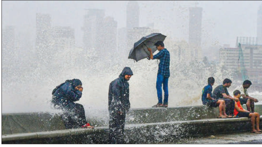
अदेबानि राजथानि दिल्ली- एनसिआरआव मौसुमि बोथोरआ एक्टिभ जानानै दड। राजथानिनि सुबुफोरा सेप्टेम्बर दानआवनो नभेम्बर दानबादि गुसु मोन्दौ। बेनि गेजेरजौं दिल्ली

गोदान दिल्ली, 14 सेप्टेम्बर: हादरनि माखासे राइज्योफोराव मौसुमि बोथोरआ एक्टिभ जानानै दड। सेप्टेम्बरनि गिबि सप्ताहआ जोबलांबाय, बे समआ मौसुमि बोथोरनि बिदाइनि बुब्लि जायो। नाथाय हाजोफोरनिफ्राय लानानै सा आरो गेजेर भारतनि हायेन ओन्सोलफोरनि माखासे राइज्योफोराव अखा हानाया सोलियासिनो दड। बेनि गेजेरजौं बोथोर बिफानआ दिल्ली आरो माहारियारि रजथानि ओन्सोलजौं लोगोसे हाजोयारि राइज्योफोर हिमाचल प्रदेश, उत्तराखण्डनिफ्राय लानानै रजस्तान, इडिपिजौं लोगोसे माखासे राइज्योफोराव जुब-जुब अखा हानायनि सांग्राथि फोसावदौ।