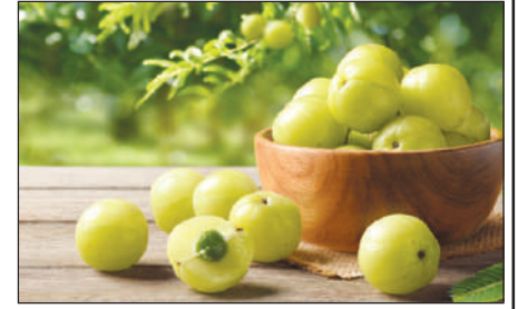
चाटनीबो जानो हायो।

देहाखौ मोजाडे लाखिनो आरो मोजाडे सामलायनो थाखाय अक्सिजेन आरो गोनांथार जाग्रा आदारनि समानथाय थानाया गोनां। बे निउट्रियेन्टफोर आरो अक्सिजेनआ थैनि गेजेरजों जॉनि गासै देहायाव सौहैयो। बेनि थाखाय मोजां थै खारनाया बयनिखुइबो गोनांथार। जुदि थैया रोजा जायो, अब्ला बेयो बिखा आरो गुबुन अंगफोरखौबो गोहोम खोखैयो। जुदि नोंथानि थैया बाँदाय रोजा जागानानै दड अब्ला बेयो गोबां बेरामफोरनि खैफोदखौ बांहोयो। थै लाथा जानायनि जाहोनाव हार्ट एटेक आरो ब्रेन स्ट्रुकिनि