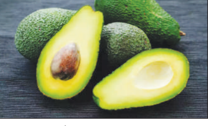
जाहोना जायो। थै गोबा खालामना फिथाइफोरआ हार्ट एटेक आरो स्ट्रुकिनि खैफोदखौ बाडइ खालामो। बेफोर थाइफोर जादों-

4. बेरिफोर: गुबुन गुबुन रोखोमनि बेरिफोरखौबो आदाराव सोफानांगोन। बेवहाय सेलिसिलेट थायो। बेयो मोनसे पुट्टिगोनां आदार, जाय थैखौ गोबा खालामनायाव हेफाजाव होयो। नोंथाड ब्लेकबेरी, ब्लुबेरी,