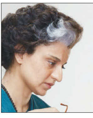
हागौ। 'इमार्जेन्सि' सावथुनखौ कंगना रनौतआनो दिथा होदों आरो बिथाड बे सावथुननि लिड

कंगना रनौतनि 'इमार्जेन्सि' सावथुनआ थाबैनो रिलिज जासिगोन। फावखुं गिआ पलिटिकेल ड्रामानि सायाव बानायनाय बे सावथुननि प्रमशनखौ जागायबाय। इन्दिरा गान्धीनि फावआव नुजाथिनो नागिरनाय कंगनाआ 1975 माइथायाव जानाय इमार्जेन्सिखौ दिन्धिगोन। नाथाय बे सावथुनआ हाइनिफ्राय बांसिन कन्ट्रिबुसिनि मैहुर जानादों। रिपर्टनि बायदिब्ला, अस्ट्रेलियाआव थानाय मोनसे सिख काउन्सिलआ 'इमार्जेन्सि' सावथुननि रिलिजनि सायाव बेन खालामनायनि दाबि दैखांदों। काउन्सिलनि बादिब्ला, सावथुनआव जारिमिनारि जाथायफोरखौ गोरोन्थियै दिन्धिनय जादों, जाय सिखफोर थैनानै थानाय सुबुंफोरनि सन्मानआव दारा नानाय बायदि जानो हागौ। बिथानि बुंनाय बादिब्ला, बे सावथुनआ सिख आरो हिन्दुफोरनि गेजेरव जैना बारायहोनायनि खामानि मावनो