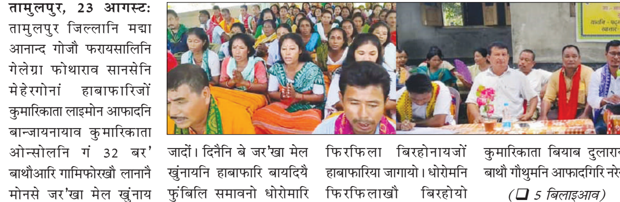
तामुलपुर, 23 आगस्ट: तामुलपुर जिल्लानि मद्या आनान्द गोजौ फरायसालिनि गेलेग्रा फोथाराव सानसेनि मेहेरगोनां हाबाफारिजों कुमारिकाता लाइमोन आफादनि बान्जायनायाव कुमारिकाता ओन्सोलनि गं 32 बर' बाथौआरि गामिफोरखौ लानानै मोनसे जर'खा मेल खुंनाय जादों। दिनैनि बे जर'खा मेल खुंनायनि हाबाफारि बायदिये फुंबिलि समावोनो धोरोमारि फि रफिला बिरहोनायजों हाबाफारिया जागयो। धोरोमनि फि रफिलाखौ बिरहोयो कुमारिकाता बियाव दुलाराय बाथौ गौथुमनि आफादगिरि नसेन (□ 5 बिलाइआव)

कुमारिकाता बियाव लाइमोन आफादनि बान्जायनायाव दुलाराय बाथौ गौथुमनि जर'खा थान्दै मेल खुंदों