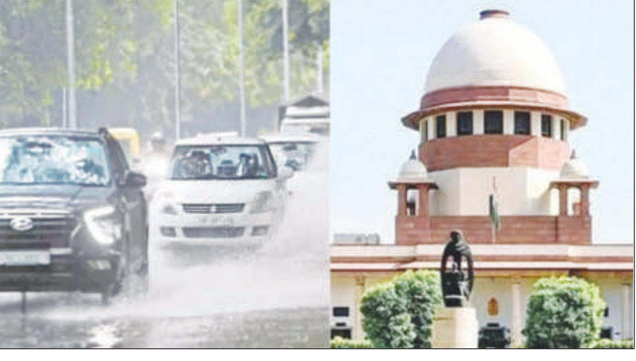
मसीहनि मोनसे बेन्सआ तामिलनाडु, कर्नाटक आरो दिल्ली, बंगल, महाराष्ट्र, केरलाखौ 6 डिसेम्बरनि सिगां बिजिरसालिखौ मटर भेहिकल