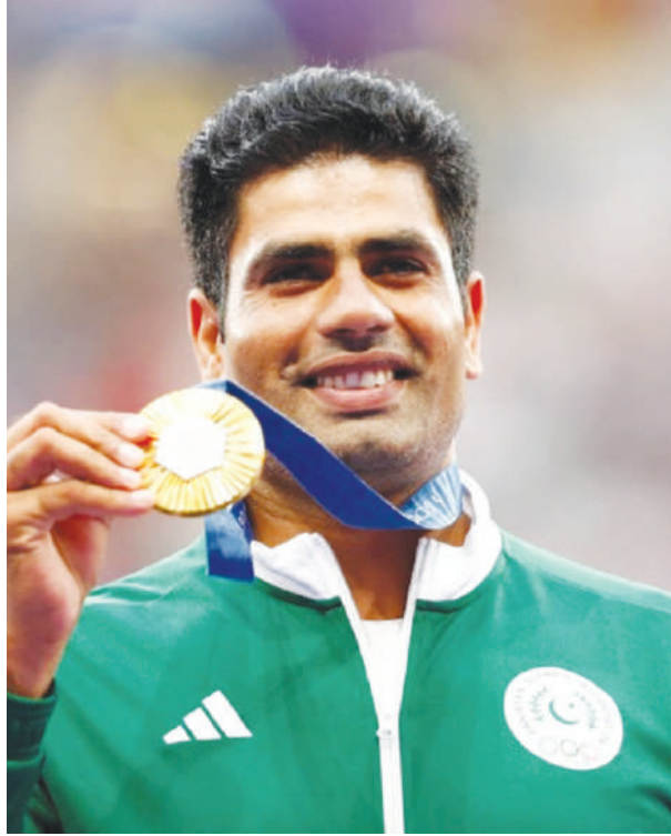
मेडेल देरहाबाय। मुंदांखा थाखाय सिंगेल इभेन्टआव मेडेल देरहानाय गिबि एथलीटमोन।

पेरिस, 10 आगस्ट: सोलिफु पेरिस अलिम्पिकआव पाकिस्ताननि थाखाय अर्शद नदीमआ जेभलिन खुबैनाय इभेन्टआव जांरिमिनारि महरै सनानि मेडेल देरहाबाय। बिथाडा जेभलिन खुबैनायनि फाइनालआव 92.97 मिटार जान्थायजों अलिम्पिक रेकर्डखौ सिफायदों। जेराव बिथाडा भारतनि निरज चप्राखौ उनाव लाखिदों। अर्शदआ अलिम्पिकनि फाइनालाव बयनिखुइ बांसिन जान्थाय खुबैनाय गेलेगिरि जाबाय। सोलिफु अलिम्पिकआव पाकिस्ताननि थाखाय बिथाडा सिंगेल इभेन्टआव सासेल' सनानि मेडेल देरहानाय गेलेगिरि जानानै दड। बे देरहानायजों बिथाडा पाकिस्ताननि थाखाय सिंगेल इभेन्टआव मेडेल देरहानाय थामथि एथलीट जाबाय। मानोना बेनि सिगां पाकिस्ताननि थाखाय महम्मद बसीर आरो उसेन साहाआवो सिंगेल्स इभेन्टआव