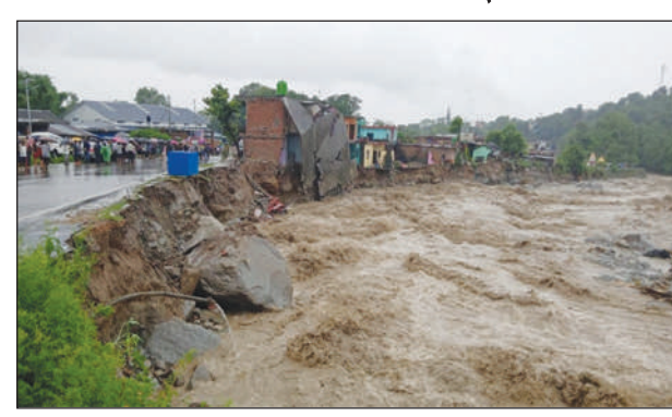
सांग्रांथि होदो। दिल्लीनि अनगायैबो पान्जाव, हारियाणा, गुजराट, छतिसगड, जम्मु-काश्मीर, उत्तराखण्ड, हिमाचल प्रदेशआवबो अखा हागोननि एलाट फोसावदो। दिल्लीनि मेक्सिमम बिदुङ शुकूबारआव 33.4 डिग्री सेल्सियस जादो। मिनिमम बिदुङ 26.5 डिग्री सेल्सियस जादो। मिनिमम बिदुङ 26.5 डिग्री सेल्सियससिम जादो। बोथोर बिगियानआ हमदांदोदि, शनिबाखालिबो जोमे दाखिनाया

गोदान दिल्ली, 3 अगस्त: हादरआव मौसुमि बोथोरनि अखाया दिल्लीनिफ्राय लानाने हाजो जायगासिम गोहोम गोरलैदो। उत्तराखण्डनिफ्राय लानाने हिमाचलनि गोबां जिल्लाफोरव अखा हानायनि जाहोनाव हा गिसिखानाय जादोमोन आरो माखासे नख'रफोरनि जिउआबो खहा जादोमोन। बोथोर बिगियानआ दिल्लीआव दिने अखा हागोननि