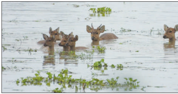
थासारिनिफ्राय बोखानानै फाहामाय होनायनि उनाव हाग्रायाव ओन्सोलनि मोन 66 हाग्रा बादा

गुवाहाटी, 7 जुलाई: काजिरडयाव दै बानानि लोमसावनाया बाइड जादोंब्लाबो जिब-जुनातफोरनि हालाय-हाफाय जानांनया बाइड जायाखे । बबेबा जायगायाव जोखोम जानाय जिब-जुनात बोखानो हादों, गुबुन जायगायाव दै बानाजों जुजिनानै जिउ खोमानाय जिब-जुनातनि गोथै सह बोखानो हादों । सोलिफु बोसोरनि गिबि दै बानानि गोहोमाव गोग्लैनानै लोमसावनाय काजिरडआव दासिम गान्दाजों लोगोसे गासै मा 114 जिब-जुनातफोर थैदों । काजिरडआ माहारियारि हाग्रामानि गुबुन गुबुन ओन्सोलाव लोमसावनाय दै बानायाव गासै मा 6 गान्दाजों लोगोसे मा 98 मै थैदों । गुबुन फार्सेथि, दै बानानिफ्राय बोखानाय मैफोरनि गेजेरव मा 11 मैफोर जोथोन लाबाय थानाय समाव थैदों । मिथिनो मोन्या बादिब्ला, दासिम मा 47 मै, मासै समबार मै आरो मासे भारतआरि सेसाजों लोगोसे गासै मा 50 जिब-जुनातफोरखी गोबाव