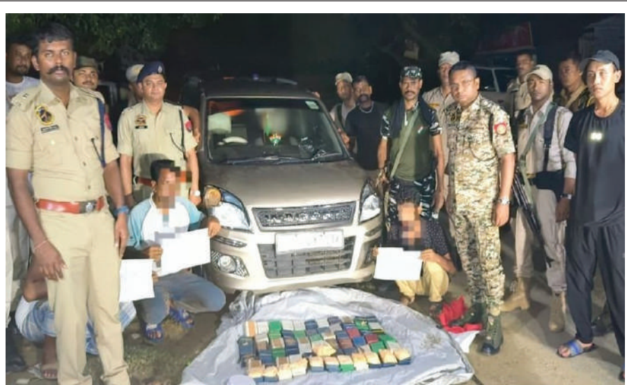
स्पेसियेल टास्क फर्स, आसाम आरो काछार पुलिसजौं खालामजानाय मोनसे जाफुंसार फेग्रा मुवानि बरेखा अपारेसनाव सिलचरआव गंसे गारिखौ हमनायजौं लोगोसे 4.5 कौटि रानि 900 ग्राम हेर इनबो बोखानो हादों।