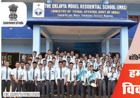
बांसिने मिथिनो थाखाय स्कैन खालाम

BODOSA ★ A Bodo News Daily ★ Saturday ★ 20 January, 2024 Kokrajhar, BTC, Assam ★ Vol.-33, Issue No. 292 ★ R.N.I. Regd.No. 40994/91, Assam Govt. Regd.No.IPRD.40/2006/3, ★ Rs.8/-