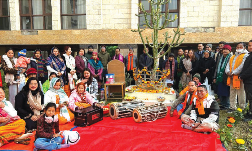
गोदान दिल्लीआव सोलोंथाइ लाहैनो थानाय गोबां फरायसा-फरायसुलिफोरा बाहागो लानाने मागो-दमासि फोरबोखो गाजा-गोमजायै फालिदो होनाने दिल्ली एनसिआर बर' थुनलाइ आफादनि फोसावदि नेहाथारि दिपामनी ब्रह्मआ बड'सानिसिम फोरमाय हर्दो।

बड'सा स्टाफ रिपटार, 18 जानेवारी: गुबुन गुबुन बोसोरफोरनि बायदिनो देरलायबो दिल्ली एनसिआर बर' थुनलाइ आफादनि दैदेन्नायाव दिल्ली बड'लेन्ड भवनआव मागो-दमासि फोरबोखो मेहेर गोनाडे गाजा-गोमजायै फालिनाय जायो। मख 'नो गोनांदि, मागो-दमासि फोरबोखो लोब्बा लाखिनाने लावखार ओंखाम जानायजो लोगोसे उन्दै-उन्दै गथ'साफोरनि गेजेराव सावगारि आखिनाय, बैसोगोराफोरनि बायदिसिना रोखोमनि गेलेनाय, दामनाय-देनाय आरो मोसाग्लनाय आयदाफोरखो खुंनय जायो। बे दमासि फोरबो फालिनाय हाबाफारिआव दिल्लीनि थागिबिनि अनगायैबो हादतनि राजथावनि