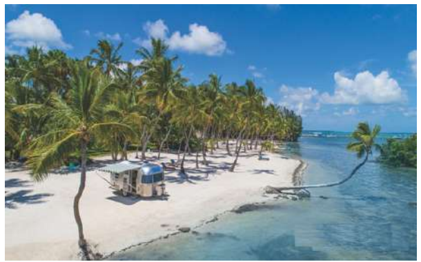
अगाती द्वीप: बे द्वीपआ बायदि रोखोमनि जाग्रा मुवा जानो मोजां मोनग्राफोरनि थाखाय बेयो पारफेक्ट जायगा। बे जायगायाव गोबां सि फुडनिफ्राय लानानै नियामिस जाग्रा आदारफोरनि गोबां फुड अप्सनफोर मोनो हायो। जाय नोंथानि भेकेसनखौ आरोबाव जर 'खासिन खालामनायाव मदद होनो हागौ। लोगोसेनो बे जायगाया स्नर्कलिं थाखायबो साबसिन होन्नानै गनायजायो।