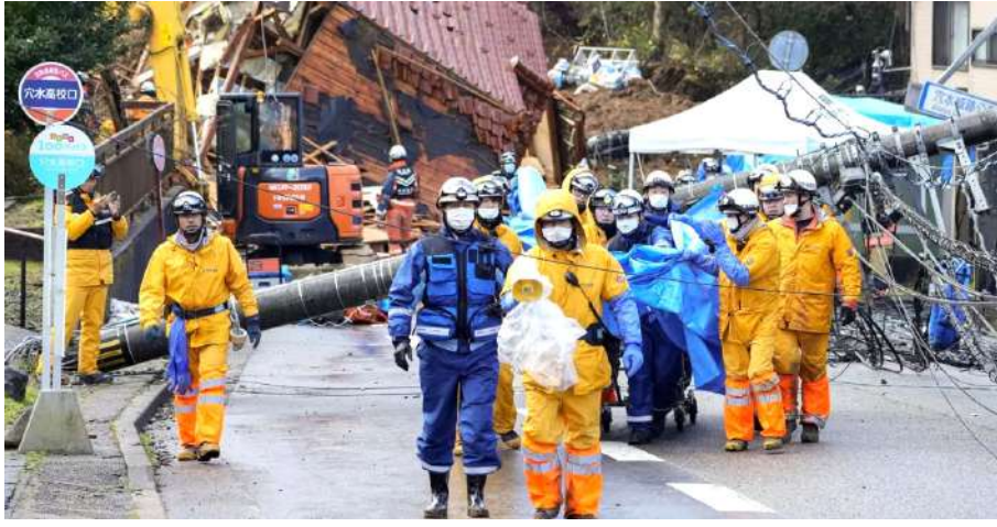
थुखाफोरनिफ्राय बायजोआव दिहुन्नो हायो। सुलुडव फोरमायनाय बायदिब्ला, मोनसे उनाव मोनसे बांग्रि मावनायजों गोदोनाय जापाननि

टकिय, 6 जानेवारी : सोनाब जापानआव फेनाय बांग्रिजों थैनायफोरनि अन्जिमाया थानाय शनिबारखालि सा 100 सिम सौहैयो। बेराफारसे रेखाथि मावसुमाफोरा बांग्रिनि उनाव बायखोन्दा थुखानिफ्राय सुबुंफोरखौ सांग्रान्थियै दिहुन्नायाव नांथाबागासिनो दड। बेनि सिगां बांग्रियाव जिउ गोमानाय सुबुंफोरनि अन्जिमाया सा 98 जादोंमोन। नाथाय अनामिजुआव आरोबाव सानै सुबुंफोर थैनायनि उनाव थैनायफोरनि गासै अन्जिमाया सा 100 जायो। बांग्रिजों बर्यनिखुइ बांसिन गोहोम गोग्लैनाय ओन्सोल इशिकाभा ओन्सोलाव बिबानगिरिफोरा उनिन सोलोखाथि आरो ख'हानि सायाव सावरयनो थारखाय जथुम्मा खालामो। बांग्रियाव गोदोनाय न'फोराव थानाय माखासे सानफोरनिफ्राय फेनायजों दावहा नांवाय थानाय सुबुंफोरखौ जोबथारनायाव बायखोन्दा