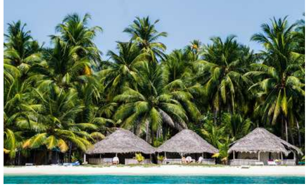
कभरती द्वीप: नोंथाड मिथिंगा बिखायाव सम बारहोनो गोसो गोनां दावबायारिफोरनि थाखाय कभरती द्वीपआ मख 'जाथाव। बेनि गेजेराव थानाय गुफुर बालाबारि आरो समायना जारै-मारै सान हाबनार्यनि नुथायआ वेखौ जोबोद समायफले हायो। नख रै एबा जगफोर बैयाव दावबायहेनो बेनि समायना बिखायाव माखासे सान रिलेक्स खालामहेनो हायो।