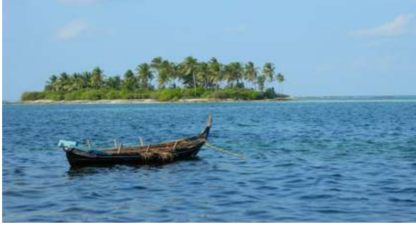
कलपेनी द्वीप: बेयो मुंदांखा टुरिस्ट स्पट नड, नाथाय बेयाव मुखुब जिउ खुंनार्यनिफ्राय माखासे सम गोजोनै थांनो सान्दोंब्ला बे जायगाया पारफेक्ट। बेयाव माखासे लकेल डिश एबा जाग्रा आदारजों लोगोसेनो स्कुबा डाइविनि गोजोन्नाय लानो हायो।

लाक्षाद्वीपआ भारतआव गुगलआव सार्च खालामजानाय 9 थि मस्ट सार्चर्ड वर्ड जानाने फैदों। बेनि जाहोनानो जादों, गाहाइ मन्श्रि मदिनि लाक्षाद्वीपआव दावबायहेनाय। बावैसो सिगां गाहाइ मन्श्रि मदिनि ससेल मिडिया एकाउन्टनिफ्राय बेनि माखासे सावगारिफोरखो शेयार खालामदों, जेराव मदिखो स्नर्कलिं खालामनाय आरो लाक्षाद्वीपनि गेजेराव थाबायगलानाय नुनो मोन्दों। बेफोर सावगारिफोरखो नुनार्यनि उनाव रावनिबो गोसोआ बै समायना द्वीपआव थांनो लुबैयालासे आरो बैयावनि समायनाखौ गावनि मेगनजों नायनो लुबैयालासे थानो हानाय नड। दावबायनो मोजां मोनग्रा आरो गोसो गुदुं दावबायारिफोरनि थाखाय लाक्षाद्वीपआव दावबायहेनो हागोन। बैयावनि मख 'जाथाव दावबायथिलि जायगाफोर जादों-