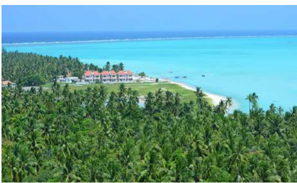
मिनिकय द्वीप: मिनिकय द्वीपआ लाक्षाद्वीपनि बयनिखुडबो गाहाइसिन बाहागोफोरनि गेजेराव मोनसे। बे द्वीपआव नख रैबो दावबायनो हायो आरो बैयाव भटिं एबा नाव गाखोनानै गोजोन्नाय लानो हायो। बेनि अनगायै वाटर स्पर्टसबो खालामनो हायो।