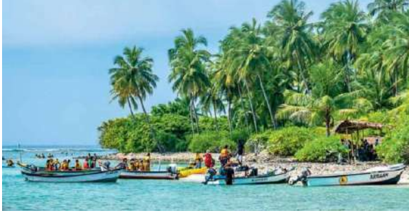
कदमत द्वीप: बे जायगाया थांनानै लकेल डिशफोरखो साखिनायाब्ला नोंथानि दावबायनाया मुलाम्फा गैयै होन्नानै बुंजागोन। मानोना बेयाव गोबां रोखोमनि फुड आइटेम आरो प्रेस सि फुड जाग्रा आदार मोन्नाय जायो। काइट सार्फि एबा सिला उरायहोनाय, स्नर्कलिं आरो डिप सि डाइविनि थाखाय बेयो मुंदांखा। लोगोसेनो बेयाव माखासे एडभेन्सोरफोरनिबो गोजोन्नाय लानो हायो।