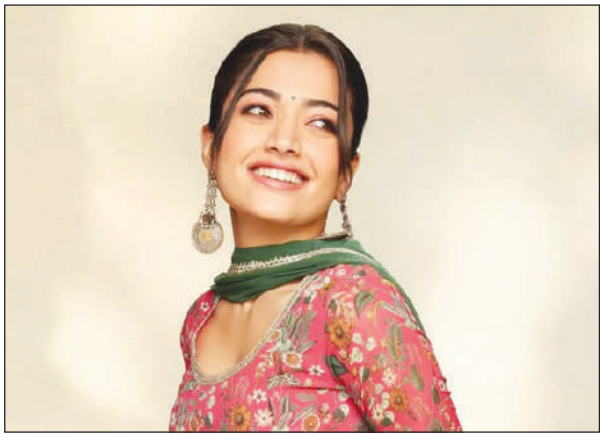
इन्डस्ट्रीआव 7 बोसोर आबुं फावखुंग्रिआ गावनि फेन्सफोरनो जाबाय। बे जरखा खाबुआव साबायख'र बावनानै गोसोनि

रश्मिका मन्दनाया 2016 आव ऋषभ शेट्टिन सावथुन 'किरिफोर्टि' जों गावनि के रियारखौ जागायदोंमोन। इन्डस्ट्रीआव रश्मिकानि 7 बोसोरनि दावबायनाया गोबां मोजाडै बारग'लादों। फावखुंग्रिआ माखासे हिट आरो सुफारहिट सावथुनफोरव फाव खालामदों आरो बे दावबायनाया दासिमबो सोलिंगासिनो दं। 2023 नि 30 डिसेम्बरआव रश्मिका मन्दनाया