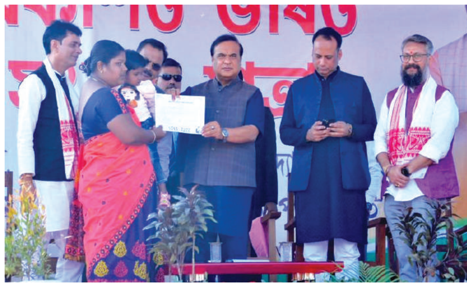
बिथांखिफोरनि खाबुखौ 100 सौखोन्दो मुलाम्फायारिफोरनो सम बादियै होनाय आरो जाय हारोंथाय सुबुंफोरा दासिमबो सरकारि बिथांखिनि खाबुनिफ्राय (□ 5 बिलाइआव)

दिसपुर, 21 डिसेम्बर: गिबि मन्थि उ हिमन्त बिश्व शर्माआ दिने कामरुप जिल्लानि रामपुर जौगाखां खोन्दोनि सिडाव थानाय उपरहालि गामि पन्थायतनि आरखि गोजोसिन गेजेरारि फरायसालिनि गोलोग्रा फोथाराव जौगाखां भारत संकल्प यात्राजों लोब्बा लाखिनानै खुनाय हाबाफारिवाव बाहागो लायो। बेनि लोब्बायै गिबि मन्थिआ बुडेदि, थानाय 15 नभेम्बरखालि ट्राइबेल गोग्गाखां साननि लोब्बायै गाहाइ मन्थि नरेन्द्र मदिआ जौगाखां भारत संकल्प यात्राखौ जागायजेन्दोंमोन। सरकारि