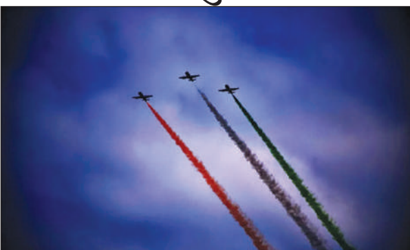
भारतयारि एयारबेटिक्स लिमिटेडनि गेजेरखौ डिजाइन गोनां मोनफ्रोम बोथोराव माल्टि मिशनआव जाफुंसार हेलिकप्टरफोरा दड। हेलिकप्टरफोरनि जर 'खाथे बेखौ सान्थियारि बिफानफोरनि थाखाय बाहायजाथाव खालामनाय जादों। रैखाथि बिफानआ फोरमायनाय बायदिल्ला सारं डिस्प्ले टीमआ मुलुगानडे 385 निखुड बांसिन जायगाफोराव 1200 निखुड बांसिन खेव गावनि दावहानि हुदाखौ दिन्थिखांबाय। एयार स्व 'खौ खुंनाय एक्सपिरियानि एमडि लोक चेत लेमआ फोरमायोदि, बे हाबाफारियाव एयारबेस, बिएइ सिस्टेम्स, बई, एफिक, कमेक, रात्स रायस बायदि मुलुगानि मोन 20 जौसिन थाखोनि उरं जाहाज कम्पानीफोरा चीन, चेक गन' यइज्यो आरो करिया बायदि दर 16 हादतफोरखौ बाहागो लाहोगोन।

सिंगापुर, 19 फेब्रुवारी: भारतयारि अखांमा सान्थिनि सारं एयारबेटिक टीमआ मंगलबारनिफ्राय थांखि लानाय सिंगापुर एयार स्व 'आव गोखेडौ एयारबेटिक्स दावहानि हुदाखौ दिन्थिनो थाखाय थियारि जाबाय। सांणि दिन्थिग्रा फिरेआव फेंगौ 20 निफ्राय 25 फेब्रुवारीसिम खुंनो लानाय सानबानि बे हाबाफारियाव दं 50 निखुड बांसिन हादतफोर आरो ओन्सोलफोरनि बांसिन कम्पानीफोरा बाहागो लागोन। सुलुडाव फोरमायनाय बायदिल्ला थांनय 2003 आव दानाय सारं हेलिकप्टर डिस्प्ले हान्जाया गावसोरनि गिबि हाविमायारि अखांमा सान्थिनि सारं हेलिकप्टर डिस्प्ले टीमनि सा 71 जवानफोर थांनय मोनसे हान्जाया गं 5 सरासन्ना हेलिकप्टर (एएलएच) जों लोगोसे मेगा हाबाफारियाव बाहागो लागोन।