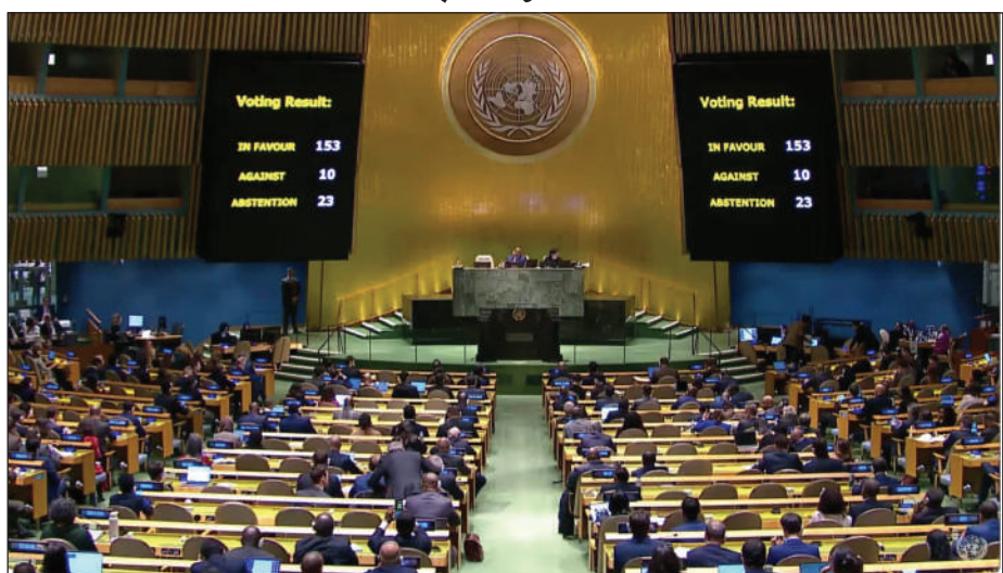
मंगलबारनि फुं आव जागोन। एसिएपेटेड प्रेसनिफ्राय मोनोनो हानाय आल्जेरियाजों थियारि खेवसे फोरमायो। ड्राफ्टआ इज्राइल आरो हामासखौ गेजेर हायुंआरि आयेनि फारसे दाबि खालामो

जेरुसालेम, 19 फेब्रुवारी: इज्राइल आरो हामासनि गेजेराव दावहाया सोलिगासिनो दं। जुथाइ हादरा मंगलबाराव दावहा दोन्थ 'नाय जागोन ना जाया बेनि सायाव भट होगोन। जुथाइ हादर रैखाथि गौथुमा गाजायाव गोखे दावहा दोन्थ 'नायनि दाबि खालामनानै आरबजों मदत होजानाय मोनसे थांखिनि सायाव मंगलबाराव भट होनायनि आसा दं। बेजों लोगोसे आमेरिकाया भट आव भट ' बाहायनो फोसावदों। आरब थादें आल्जेरियाया ड्राफ्ट थांखिखौ जोबथा खालामनाय, जायखौ गौथुमाय भट होनो हायो। गौथुमाय राजथान्दफोरा मुं दोनोनो गोसो जानानै बूंदोंदि, भट आ