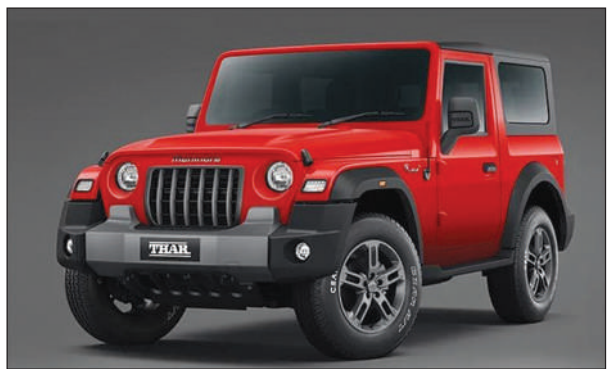
स्टाइल एसइउभिखौ लन्च खालामनायनि बोसोरथाम उनाव आरो गुबुन गारि बायाग्राफोरनिफ्राय गिदिर फिथाइ मोनसेवावबो महिन्द्रा तारआ हाइ डिमान्डआव दड। तारनि सुबुंफोरजों अन्साइजनायनि फिथाइ महैर अट 'मेकारआ 2024 नि गिबि दानाव गासै भारतआव गं

गोदान दिल्ली, 19 फेब्रुवारी : महिन्द्रा तारआ भारतआव बयनिखुड पपुलार एसइउभिफोरनि गेजेराव मोनसे। बक्सि आरो गिदिर एसइउभिनि सुबुंफोरजों अन्साइजनाया बांनयजों लोगोसे महिन्द्रा नि बे गंधाम दरजा गोनां आफरडार एसइउभिनि डिमान्डआ लांथ्रियै बांगासिनो दड। डिमान्ड बांनयखौ आवुं खालामनो थाखाय नख 'रारि गारि बांनायग्राया गावसोरनि प्रडाक्शनखौ बांनायदों जायनि जाहोनाव आधिखालाव वेदिते पेरियडआ खमायनोनै 52 सप्ताह जाबाय। बेनि ऑंधिया बेनोदि, जुदि नोथाड बे बोसोरनि फेब्रुवारी दानाव तार बुक खालामोब्ला बेखो 2025 नि जागायजेनायाव न 'आव लांनो हागोन। भारतआव बे लाइफ