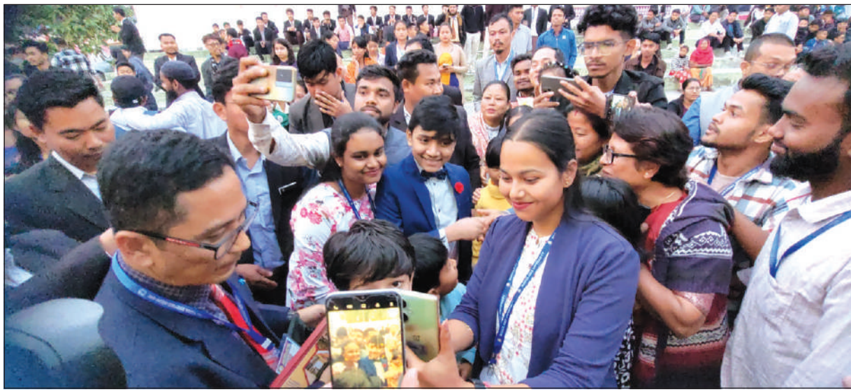
मुलुगानि उन्दैसिन प्रफेसार सुबर्न आइजाक बारीआ बड'लेन्ड मुलुगसोलोसालियाव दावबायफैनाय समाव फरायसा, फारोंगिरिफोरा बारीजो सेलफि लानायाव मुखुब जानाय बुख्लि।