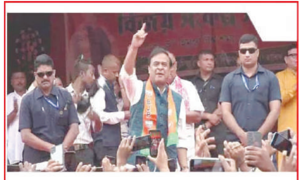
फजफिनो थाखाय भटार रइजोफोरखौ (□ 5 बिलाइ आव)

गुवाहाटी, 16 एप्रिल: सनितपुर लकसभा बियाबनि बिजेपिनि बिजाथि रन्जित दत्तनि जानानै बिसायख'थि फोसावदिनाय थांखिजों समबाराव बिहाली बिधान सभानि बेंखनाव थाया ब्रह्मजान साहा बागानाव बिगि मन्थि डू हिमन्त बिश्व शर्मा आ नुजाथि हैनायखौ नुनो मोन्दों। ब्रह्मजान साहा बागाननि बेवलां गेलेप्रा फोथावा खुंफुनाय मोनसे गेदेर बिसायख'थि फोसावदिं मेलायव गिबि मन्थि आ बाहागो लायो। बे हाबाफारियाव बाहागो लानानै गिबि मन्थि आ सनितपुर लकसभा बियाबनि मोन 9 बिधान सभा लकसभा बियाबआवनो जैरेबायदि भटार रइजोफोरखौ बाहागो लानायखौ नुनो मोन्दों बेखौ नायनानै नो हमनो हायोदि, लकसभा बिसायख'थियाव बिजाथि रन्जित दत्त आ गोबां अन्जिमानि भटनि फारगथियाव देरहासार जागोन होना गार्वनि बिबुंथियाव फोरमायदों। सनितपुर लकसभा बियाबनि जौगाखानायनि सार्थयाव बिजेपिनि बिजाथिनो भट होनायजों लोगोसेनो थामथि खेबनि थाखाय नरेन्द्र मदिखौ भारतनि गाहाइ मन्थि मासियाव